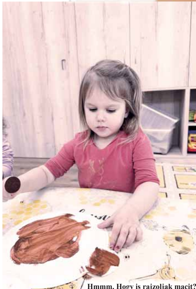
Hmmm. Hogy is rajzoljak macit?