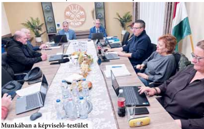
Munkában a képviselő-testület

A korábbi gyepmester felhagyott tevékenységével, ezért új szerződések kötésére volt szükség, hogy a kőborkutyákat biztonságosan el lehessen helyezni, ha gazdájukat nem tudják azonosítani. Ugyanígy össze kell gyűjteni a közterületekről az elhullott állatokat is. Ecser önkormányzata a Menhely az Állatokért Környezetvédelmi és