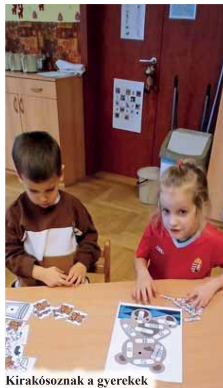
Kirakósoznak a gyerekek