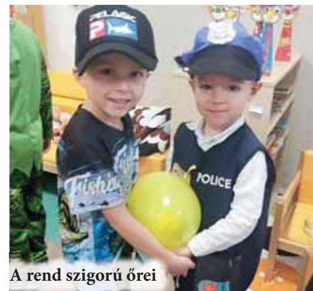
A rend szigorú őrei