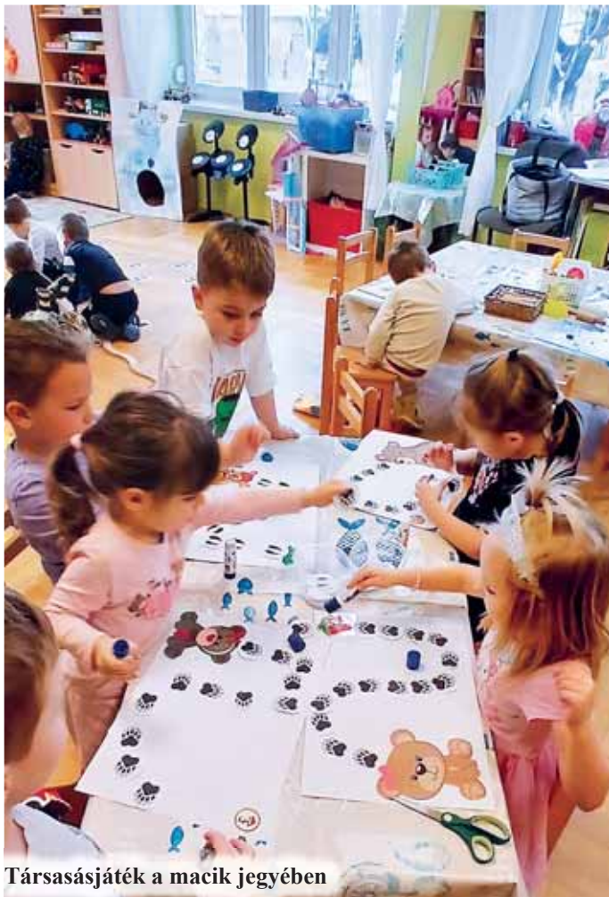
Társasjáték a macik jegyében