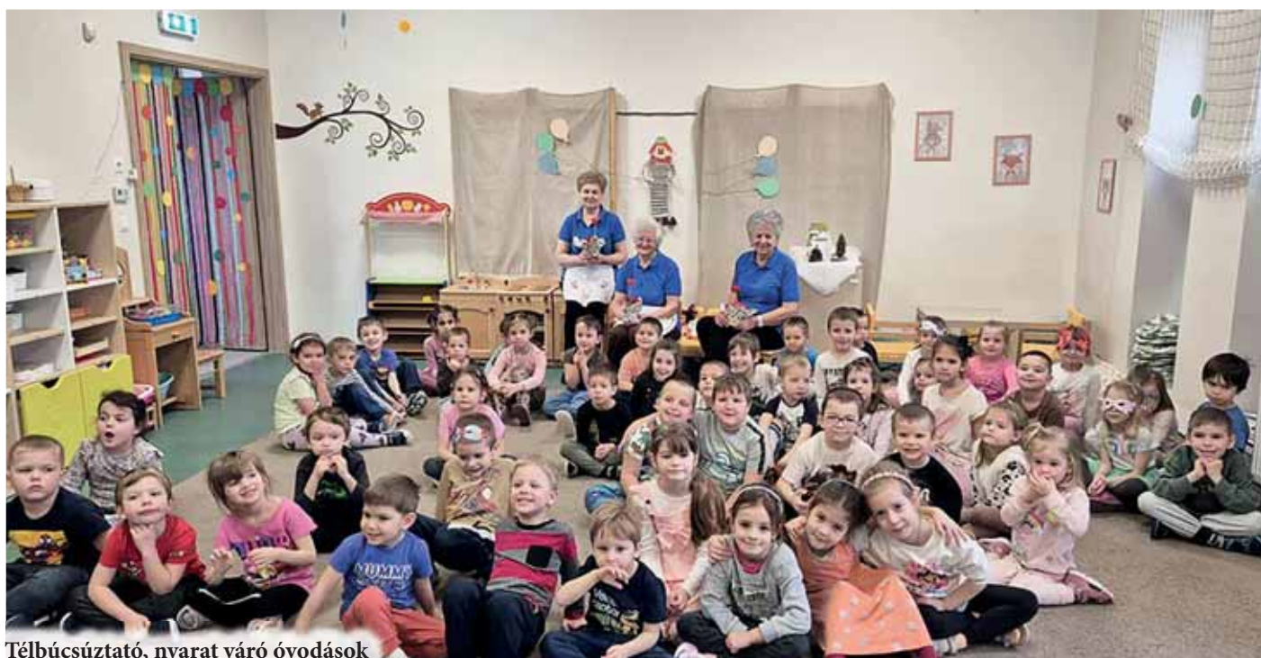
Télbúcsúztató, nyarat váró óvodások