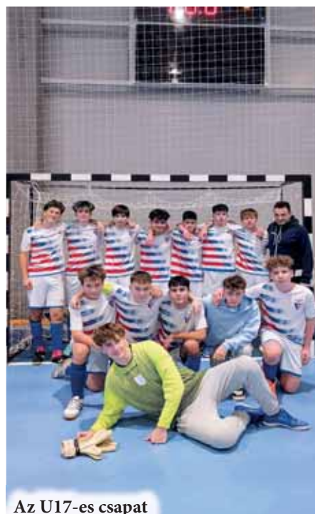
Az U17-es csapat

Továbbra is szoros együttműködésben dolgozunk az UFC Gyömrő egyesülettel, amely mind szakmai, mind játékosmozgási szinten sokat jelent számunkra. A közös munka lehetővé