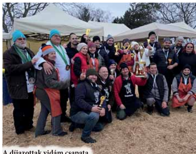
A díjazottak vidám csapata