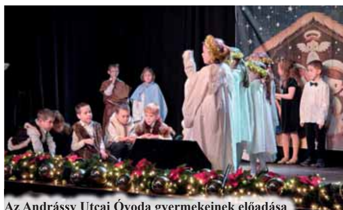
Az Andrásy Utcai Óvoda gyermekeinek előadása

közösségnek, hanem igazi ajándék. Önök azok, akik nyugalmat, mérsékletességet, bölcsességet közvetítenek a fiatalabb generációk felé. Egy olyan világban, ahol minden gyorsan változik, ahol sokszor kapkodunk, idegeskedünk, különösen nagy érték az az életbölcsesség, amit Önök hordoznak.