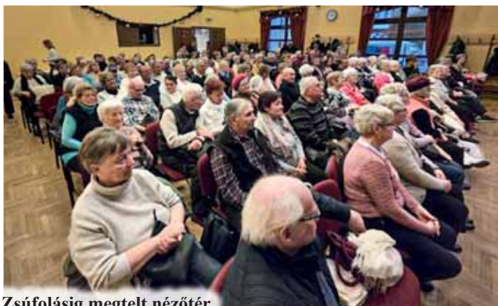
Zsúfolásig megtelt nézőtér

Önök, nyugdíjasok, nem a múlt emberei, hanem a jelen tartópillérei. Önök adják azt a lelki háttérrel, azt a biztos pontot, amelyhez a fiatalabb generációk vissza tudnak nyúlni, amikor eltévedni látszanak ebben a gyors világban.