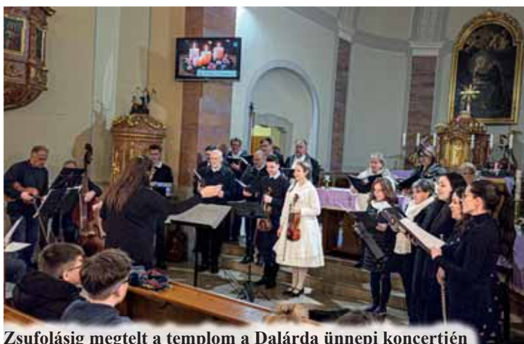
Zsúfolásig megtelt a templom a Dalárda ünnepi koncertjén