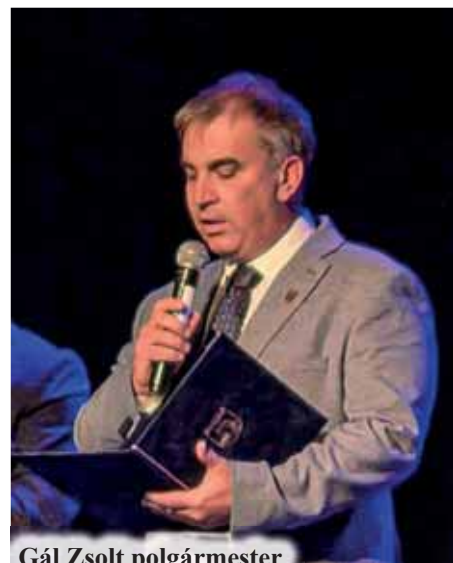
Gál Zsolt polgármester

Külön köszönet illeti azokat, akik ma is aktívan tesznek közösségünkért – legyen az hagyományaink ápolása, tapasztalataik megosztása, vagy egyszerűen csak a jelenlétük, amely bizottságot és erőt sugároz környezetüknek.