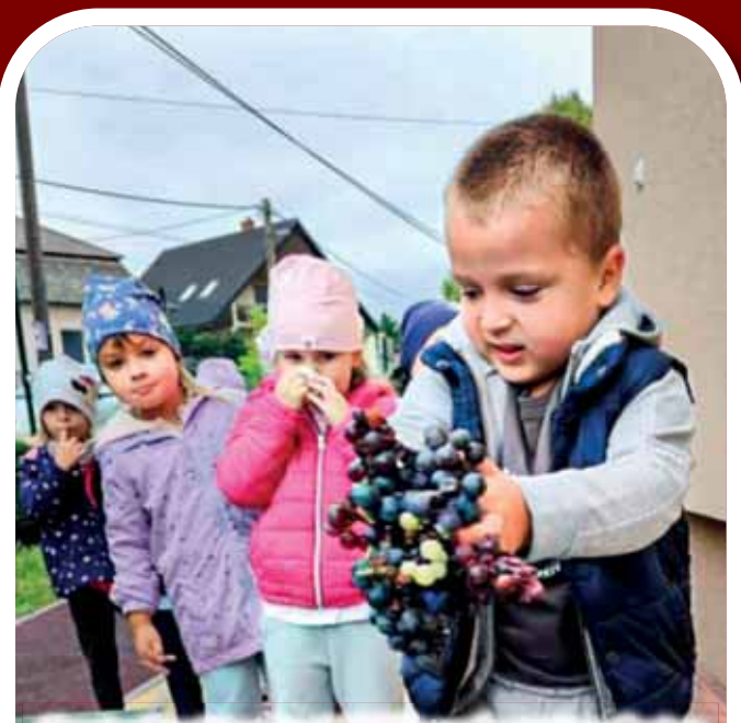
Szeptember 29-e, Szent Mihály napja egy igen fontos alkalom volt eleink életében, ekkor kezdődtek meg az őszi-téli munkák. A hét utolsó napján a mustkészítés is izgalmasra sikeredett. A borongós idő ellenére lelkesen készülődtek a gyerekek. Reggel szőlővel érkeztek, majd mindenki kipróbálhatta milyen darálni és préselni a szőlőt. Az így elkészült mustot pedig ebéd után fogyasztották el.