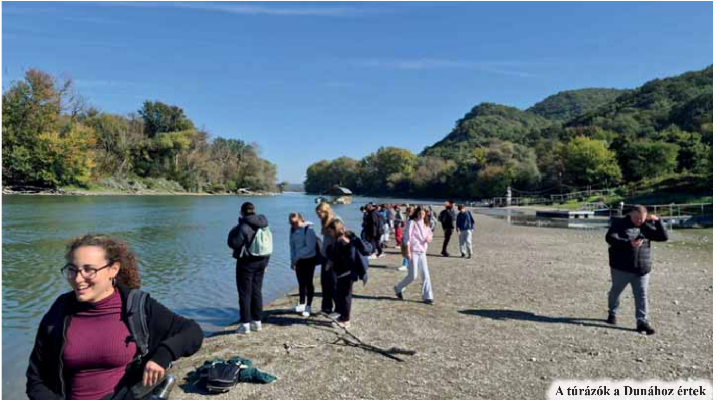
A túrázók a Dunához értek

Október 4-én második alkalommal került megrendezésre a Laky-túra programunk, melynek célja, hogy a gyerekek több időt töltsenek természetközben, illetve megismerkedjenek az ország néhány rejtettebb szépségével. Az első túránk Hollókőre vezetett, ekkor a részvételi létszámból arra a következtetésre jutottunk, hogy rendszeresíteni kell ezeket a túrákat. Terveink szerint minden tanévben szervezünk egy őszi és egy tavaszi túrát, hiszen ezek kifejezetten azok az évszakok, amikor érdemes a természetben lenni, barangolni, mert a környezet olyan arcát mutatja a kirándulók számára, ami figyelemre méltó.