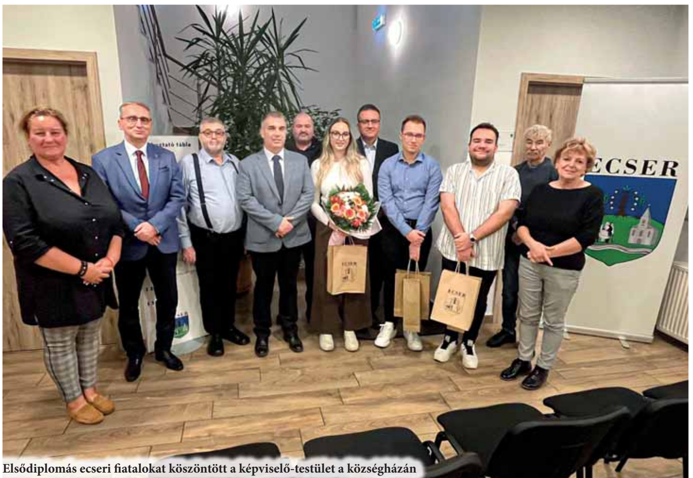
Elsődiplomás ecseri fiatalokat köszöntött a képviselő-testület a községházán