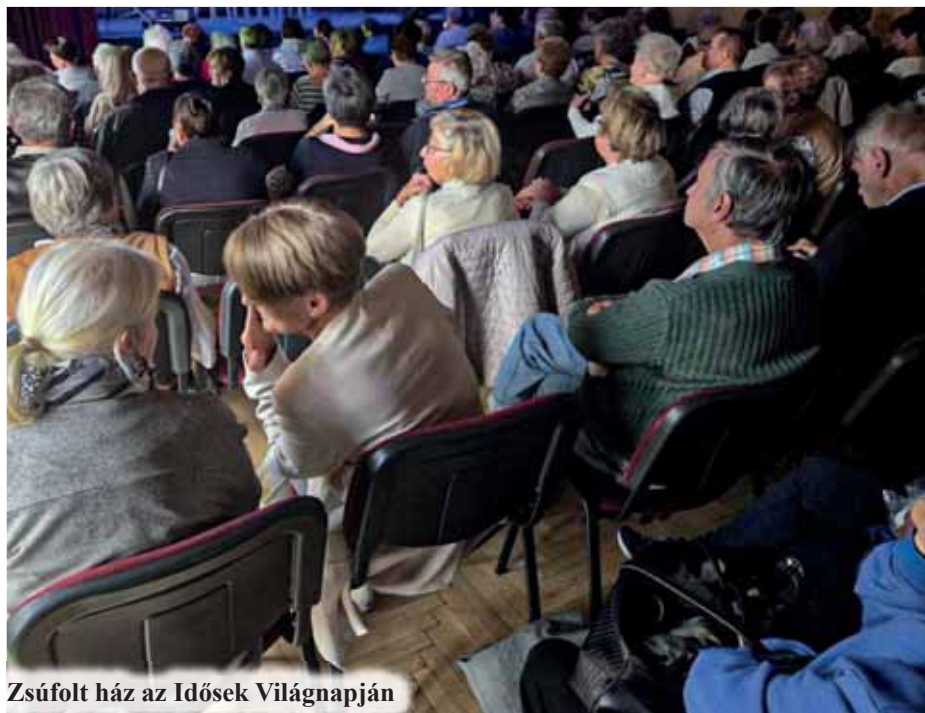
Zsúfolt ház az Idősek Világnapján