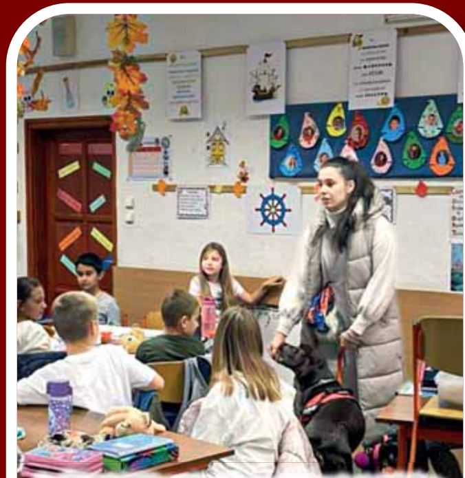
Az Állatok Világnapjával kapcsolatban tartottak foglalkozásokat a Laky Ilonka Általános Iskolában. A fotókiállítás, az aszfaltrajzolás, sőt a számítástechnika órák is az állatokról szóltak ezen a napon. A gyermekek és a pedagógusok is olyan ruhában jelentek meg, amely erre a napra emlékeztette őket. Elhozták az intézménybe kedvenc állatos plüskéiket is.