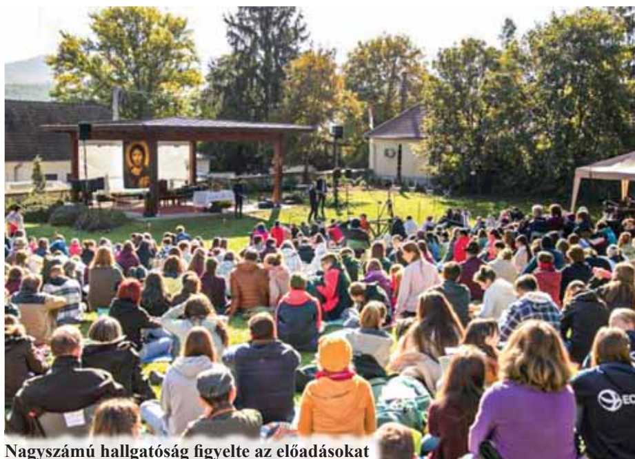
Nagyszámú hallgatóság figyelte az előadásokat