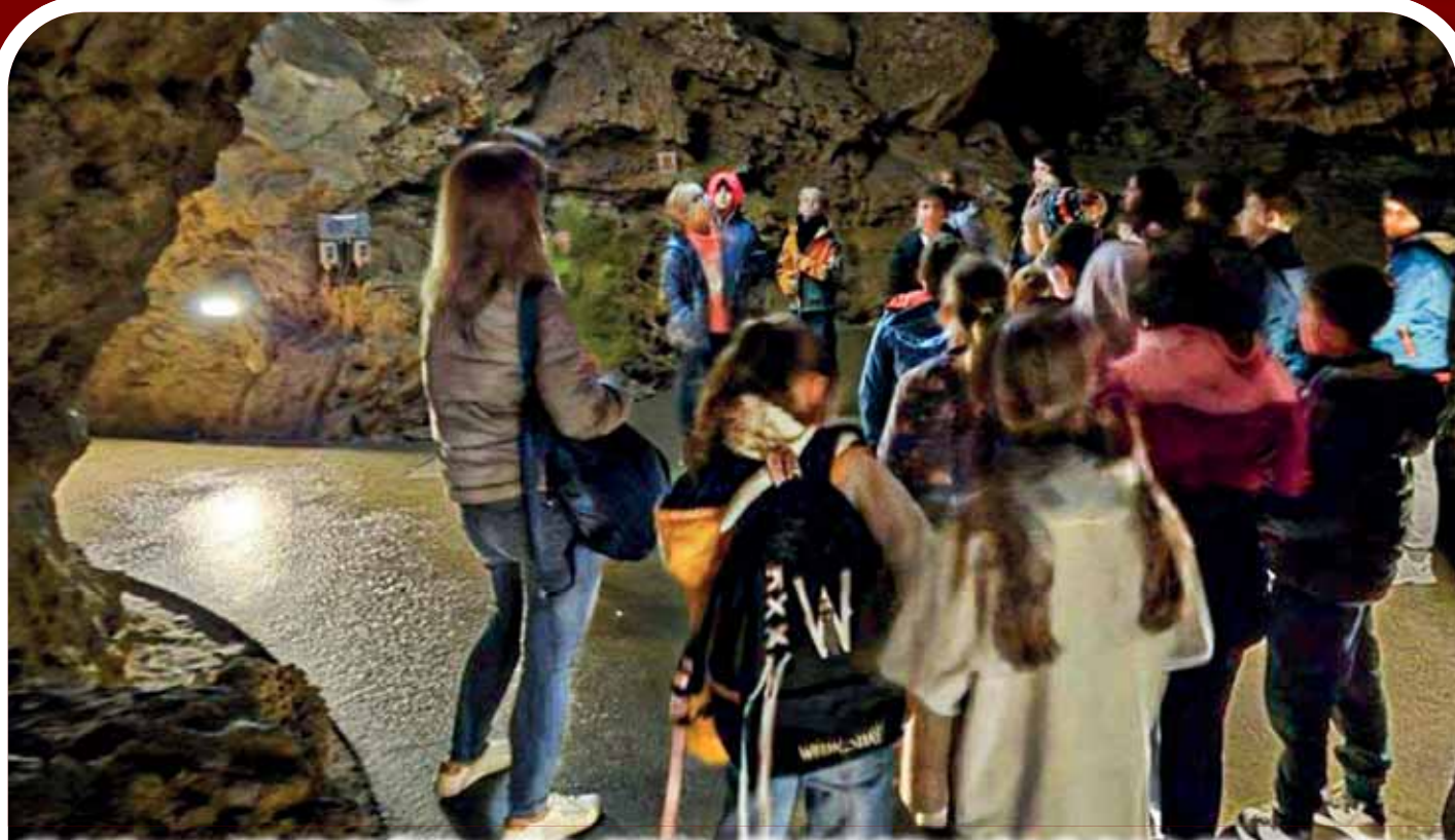
Megjutalmazza a Laky Ilonka Általános Iskola a kitűnő tanulóit. Kiránduláson vehetnek részt. Az idén a Szemplő-hegyi barlangban ismerkedhettek a természet szépségeivel.