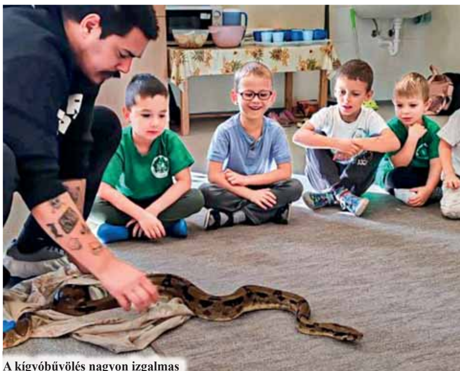
A kígyóbűvölés nagyon izgalmas