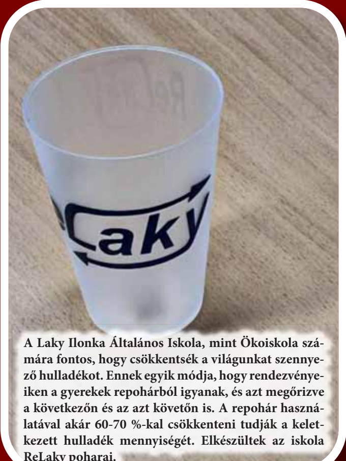
A Laky Ilonka Általános Iskola, mint Ökoiskola számára fontos, hogy csökkentsék a világunkat szennyező hulladékot. Ennek egyik módja, hogy rendezvényeiken a gyerekek repohárból igyanak, és azt megőrizve a következőn és az azt követően is. A repohár használatával akár 60-70 %-kal csökkenteni tudják a keletkezett hulladék mennyiségét. Elkészültek az iskola ReLaky poharai.