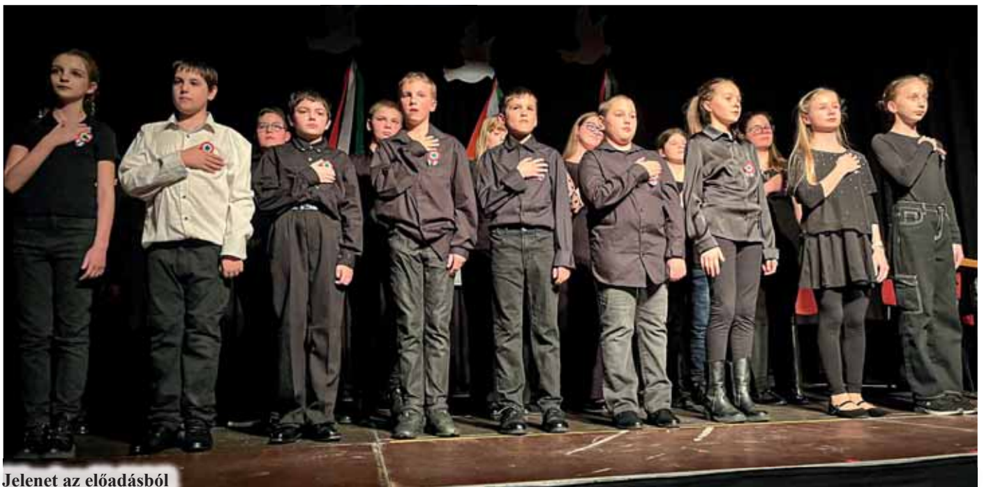
Jelenet az előadásból