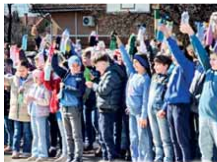
A víz fontosságáról való megemlékezés az iskolaudvaron