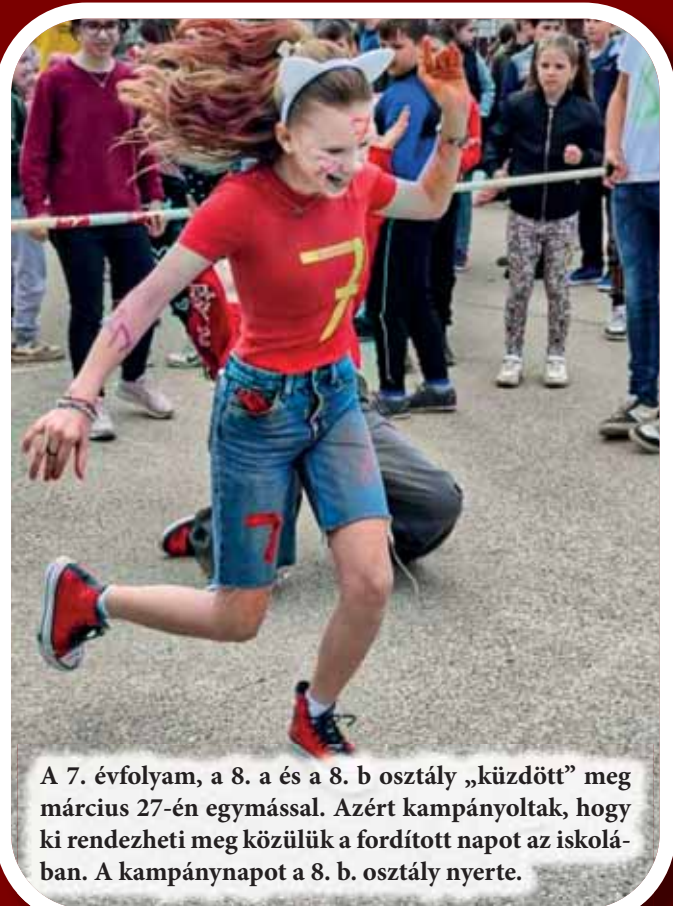
A 7. évfolyam, a 8. a és a 8. b osztály „küzdött” meg március 27-én egymással. Azért kampányoltak, hogy ki rendezheti meg közülük a fordított napot az iskolában. A kampánynapot a 8. b osztály nyerte.