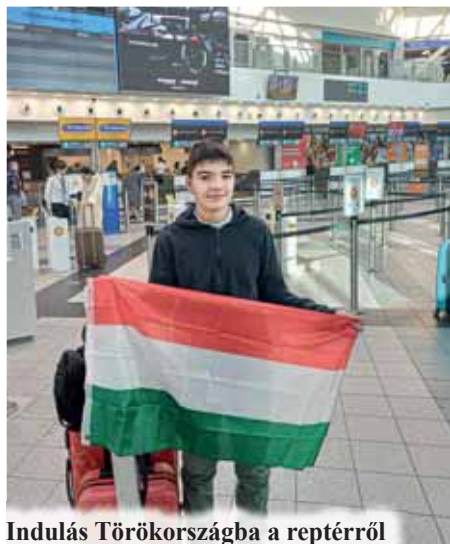
Indulás Törökországba a reptérről