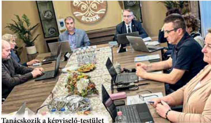
Tanácskozik a képviselő-testület

képviselők a Közigazgatási és Területfejlesztési Minisztérium által kiírt tüzelőanyag vásárlásának támogatására vonatkozó pályázatra. A testület elfogadta Ecsér Nagyközség Önkormányzatának közbeszerzési szabályzatát. Szintén