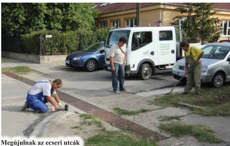
Megújulnak az ecseri utcák

önkormányzati hatáskör. Ezekről is már több alkalommal írtam, hogy milyen nehézségek vannak. Az önkormányzati törvény nem teszi kötelezővé azt, hogy ezeknek az utcáknak burkoltnak kell lennie, de a képviselők és jómagam is azt gondolom, hogy az élıhetőség okán fontos ezeket az utcákat szilárd burkolattal ellátnunk. Az elmúlt időszakban ebben is sokat léptünk előre. Az idei év várható fejlıstéseivel rövidesen 4 utca készül el. Gyakorlatilag 4 belterületi utcánk marad, amelyet még burkolni fogunk. Ezzel elérjük, hogy a belterületi lakott, burkolt utcák aránya 100 százalékos lehet. Érdekeség, hogy még a fıvárosban sem érték el ezt az arányt. Az útépitések nehézségeirıl sok esetben írtam már, nagyon nagy kihívást jelentett az elızı önkormányzati vezetés idején parcellázott területek kezelése. A Kálvária és a Belső Kálvária utcái közül 2 kapott burkolatot a terület lakóterületté alakítása során.