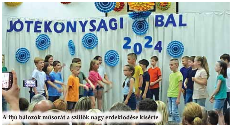
A ifjú bálózók műsorát a szülők nagy érdeklődése kísérte

Május 24-én tartotta a Laky Ilonka Általános Iskola hagyományos Jótekonysági bálját. A műsorban minden osztály saját produkcióval lépett fel, melyre hosszú időn át készültek osztályfőnökeik iránymutatása mellett. A közönség láthatta a "Tiszán innen, Dunán túl" Népdaléneklési Versenyen Arany minősítést nyert produkciót is.