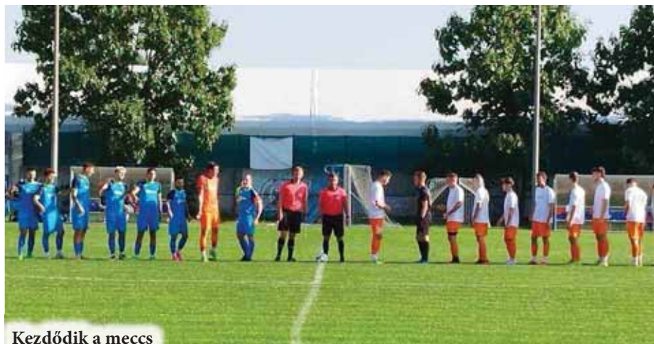
Kezdődik a meccs