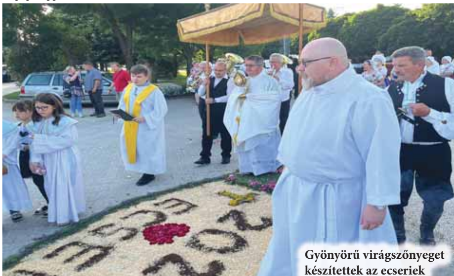
Gyönyörű virágszőnyeget készítettek az ecseriek

Én vagyok a mennyből alászállott élő kenyér. Aki e kenyérből eszik, örökké él. A kenyér, amelyet adok, a testem a világ életéért." Erre vita támadt a zsidók közt: "Hogy adhatja ez a testét eledelül?" Jézus ezt mondta rá: "Bizony, bizony, mondom nektek: Ha nem eszitek az Emberfia testét és nem isszátok a véré, nem lesz élet bennetek. De aki eszi az én testemet és issza az én vére, annak örök élete van, s feltámasztom az utolsó napon. A testem ugyanis valóságos étel, s a vérem valóságos ital. Aki eszi az én testemet és issza az én vére, az bennem marad, én meg benne. Engem az élő Atya küldött, s általa élek. Így az is élni fog általam, aki engem eszik. Ez a mennyből alászállott kenyér nem olyan, mint az, amelyet atyáitok ettek és meghaltak. Aki ezt a kenyeret eszi, az örökké él.