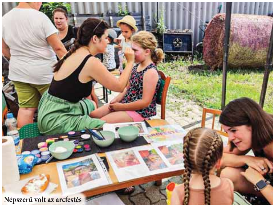
Népszerű volt az arcfestés

Családi nap szervezésével búcsúztattuk a 2023/24 nevelési évet a Cserfa Kuckó Óvodában