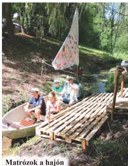
Matrózok a hajón

Balatonra, ki a Nagymamához, de olyan is volt, aki Sohaországba tartott. Viharban is hajóztak, csak úgy dobálta a tenger (vagy