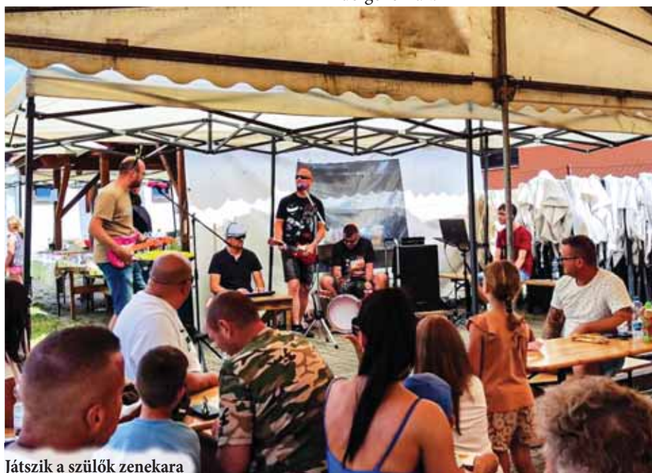
Játsszik a szülők zenekara

Népi játékokkal színesítette programjaink a „Sokadalom Népi