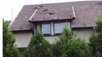
2009. április 29. Felvétel a Rákóczi Ferenc utca 46/B. szám alatti ház tetőrongálásáról

azonnali balkanyart ír elő a felszálló gépeknek, hogy elkerüljék Rákoshegy lakóházait. A kötelező adatszolgáltatás szerint a gépek 72 %-a megsérti a jogszabályban előírt felszállási irányt. 3. Nem történt meg a kijelölése a zajgátló védőövezetnek, amely a repülőter működési engedélyének feltétele. 4. Repülőterek környezetében – nemzetközi előírás szerint – kötelező biztonsági védőövezet kijelölése (5 km-en belül 300 méter alatt repülnek a gépek, ahol probléma esetén már nem tudnak korrigálni), ami a lakóházak és lakosok biztonságát hivatott védeni. Ennek kijelölésére még soha nem került sor, a mulasztásos jogszabálysértő állapot továbbra is fennáll. 5. A Repülőter nem volt hajlandó a repülésre vonatkozó közérdekű adatokat a lakosok számára szolgáltatni, jogerős bírósági ítélettel kellett erre kötelezni. Az ítélet ellenére