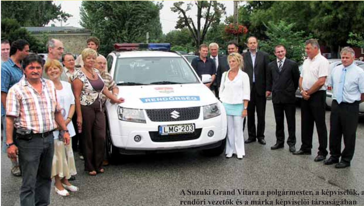
A Suzuki Grand Vitara a polgármester, a képviselők, a rendőri vezetők és a márka képviselői társaságában

Egy rendőri szolgálatra alkalmasra tett Suzuki Grand Vitara terepjáró gépjárművet, egy komplett projektoros kivételű rendszert, illetve a kerületi kapitányság közrendvédelmi osztály járőr állománya megújult leíró helyiségét, új bútorzattal és informatikai gépparkkal adott át augusztus 5-én Rákosmente önkormányzata a városrész rendőrségének.