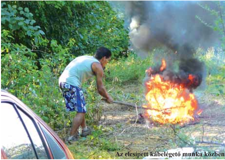
Az elcsipett kábelégető munka közben

Egy órával később a XVII. kerületi Csordakút utca melletti területen két személy szemétkerakót, csomagolóanyagot és papírhulladékot rámolt ki egy kisteherautóból. A mezőőrök értesítették a rendőrséget, akik előállították az elkövetőket a XVII. kerületi kapitányságon. Vasárnap a Naplás útról nyíló kavicsbányában érték tetten a mezőőrök az illegális építési törmeléklerakókat. Mint jelentésük beszámolója, a kisteherautókból vödörbe gyűjtött építési hulladékot borogattak ki. Az adatokat rögzítették, a feljelentést megtették. Akik hasonló esetekkel találkoznak, hívják a 06-20-593-5266-as vagy a 400-1263-as vonalas telefonszámot.