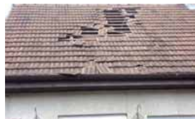
2009. március 30. Felvétel a Berzsenyi Dániel utca 54. szám alatti ház tetőrongálásáról

b./ Nem tartják be a 176/1997. (X.11.) Korm. rendeletben kötelezően előírt felszállási irányt, amely