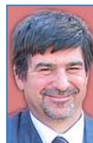
Horváth Tamás alpolgármester, önkormányzati képviselő (Fidesz), állásponjtja