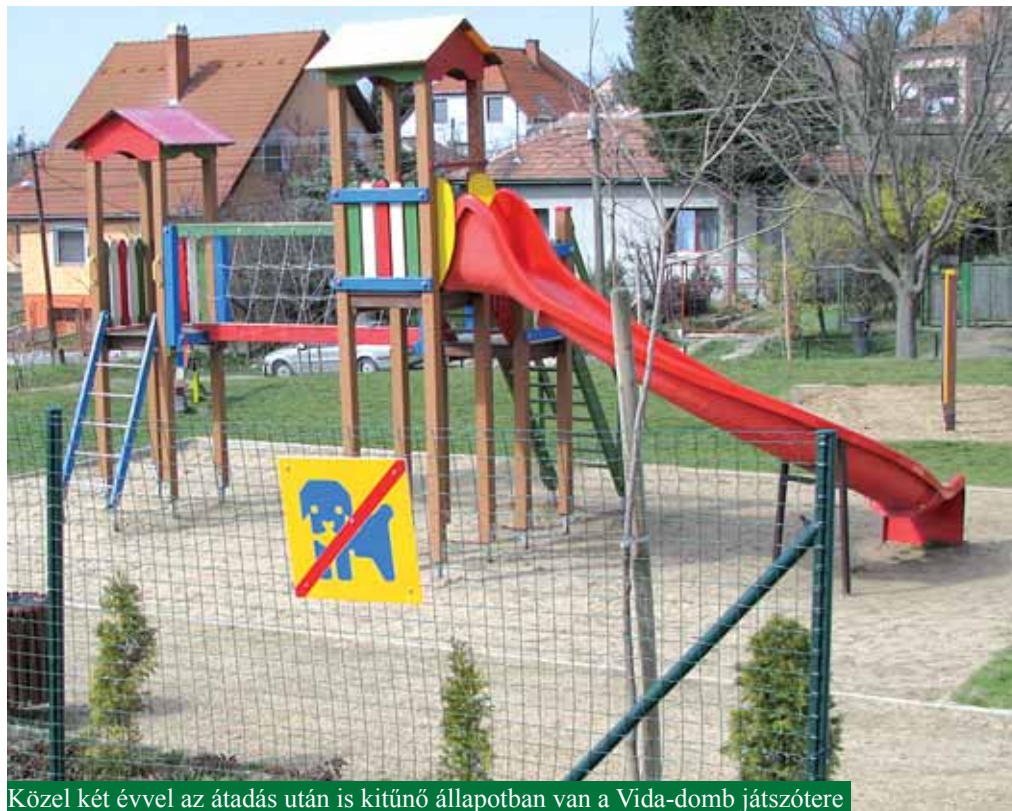
Közel két évvel az átadás után is kifűnő állapotban van a Vida-domb játszótére