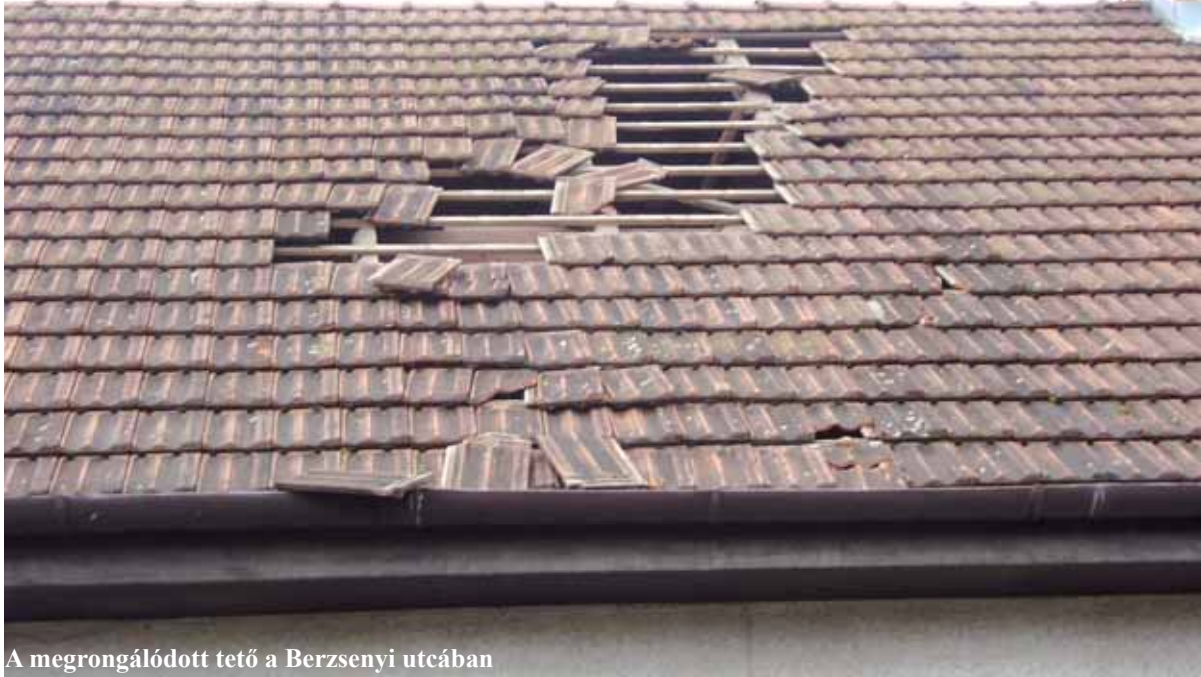
A megrongálódott tető a Berzsényi utcában