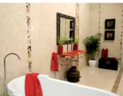
Fürdőszoba felszerelés, szaniter, burkolatok