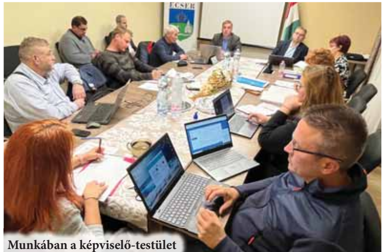
Munkában a képviselő-testület

A képviselők felhatalmazták a polgármestert jutalom kifizetésére a Maglódi Rendőrőrs tagjai részére. A képviselő-testület elfogadta a polgármester beszámolóját.