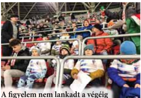
A figyelem nem lankadt a végéig