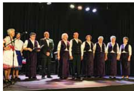
A zárójelenet. Minden szereplő a színpadon.