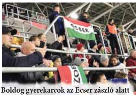
Boldog gyerekarok az Ecser zászló alatt