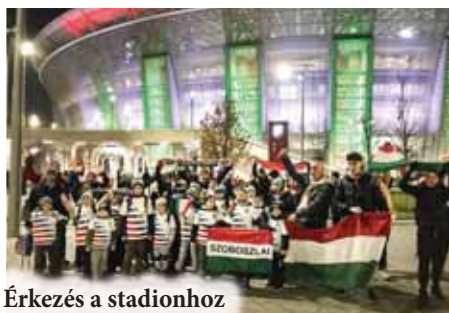
Érkezés a stadionhoz

Az Ecseri Sport Egyesület szervezésében utaztak el a Magyarország - Görögország válogatott labdarúgó mérkőzésre az ecseri gyerekek és kísérőik. Így 56 fővel több ecseri szurkolt a helyszínen a győzelemért. Magyarország - Görögország 2-1.