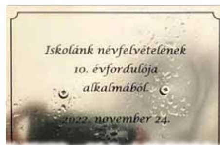
Emléktábla az iskola névfelvételi évfordulójára

Végül arról szeretnék beszámolni, hogy a Bolyai anyanyelvi csapatversenyen két csapatunk is bekerült az országos írásbeli döntőbe, ami fantasztikus eredmény. Ők a 4. osztály „Tudós Baglyok” csapata, név szerint