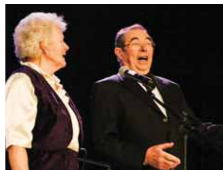
A Kuruczi Házaspár vidám dalaokat adott elő