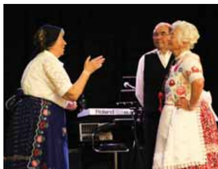
Szórakoztató jelenet dalban elmesélve