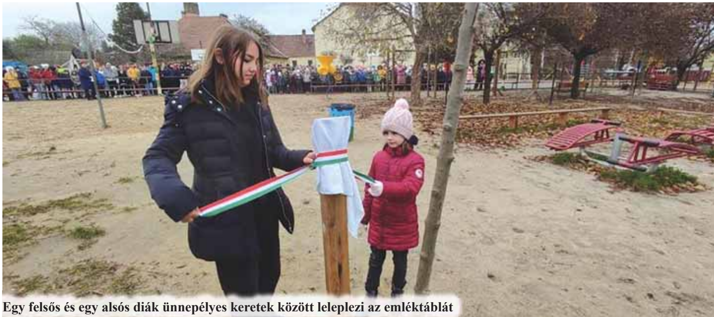
Egy felsős és egy alsós diák ünnepélyes keretek között leleplezi az emléktáblát

A november is mozgalmas, eredményekkel teli hónap volt iskolánk életében.