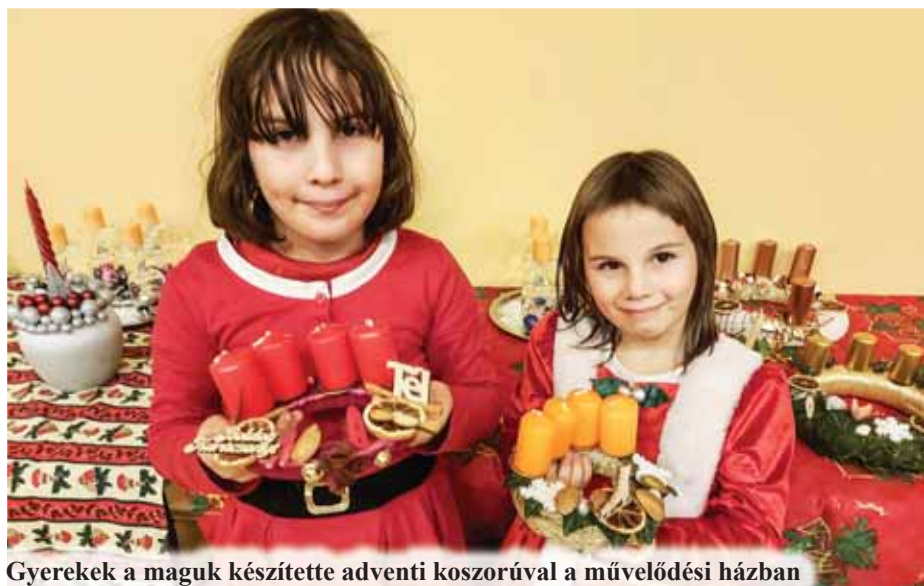
Gyerekek a maguk készítette adventi koszorúval a művelődési házban