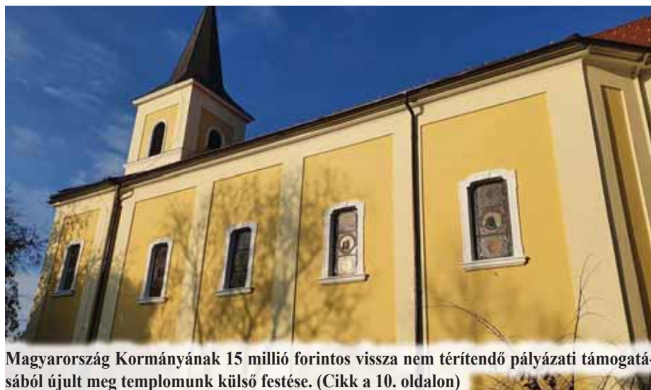
Magyarország Kormányának 15 millió forintos vissza nem térítendő pályázati támogatásából újjalt meg templomunk külső festése. (Cikk a 10. oldalon)