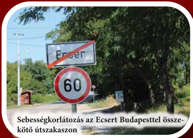
Sebességkorlátozás az Ecsert Budapesttel összekötő útszakaszon