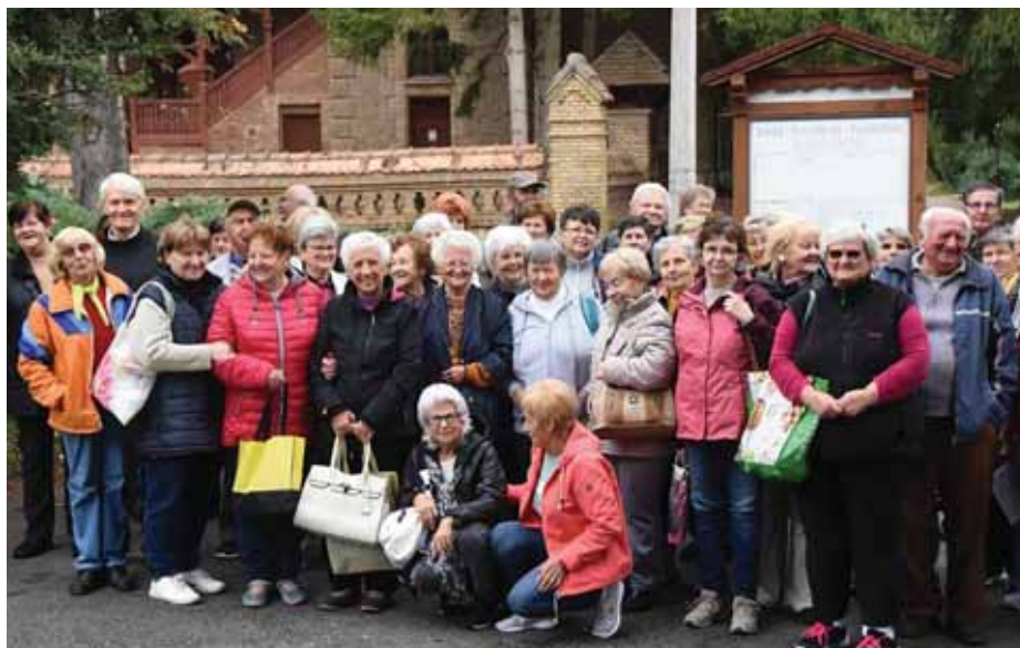
Szép napjuk volt az ecseri nyugdíjasoknak. Parádsasvárra kirándultak. Csoportképük is ott készült.