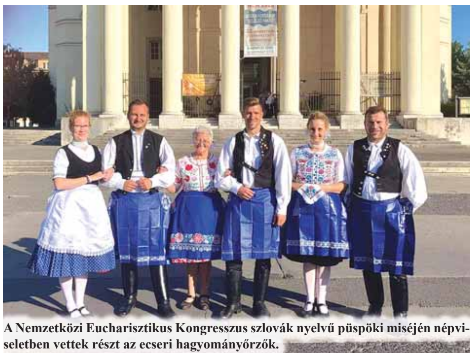
A Nemzetközi Eucharisztikus Kongresszus szlovák nyelvű püspöki miséjén népviseletben vettek részt az ecseri hagyományőrök.