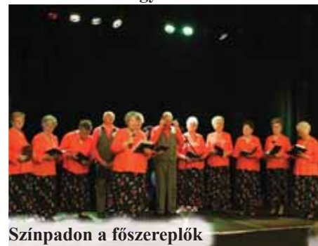
Színpadon a főszereplők