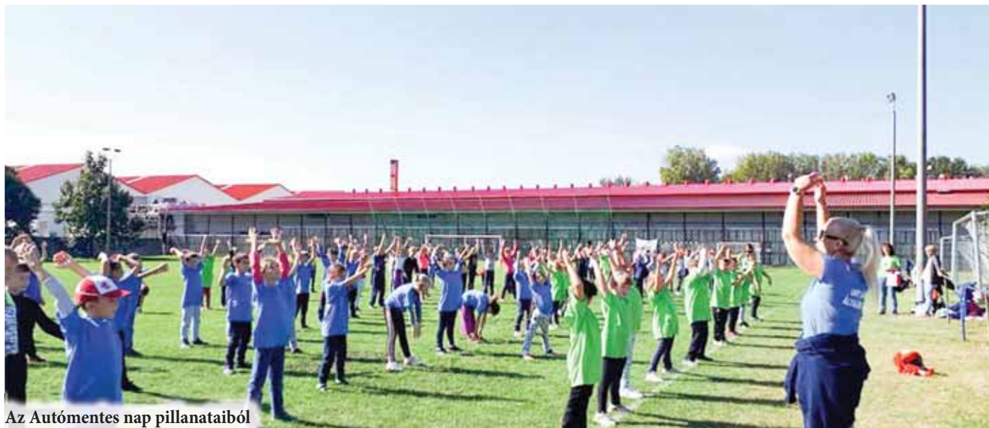
Az Autómentes nap pillanataiból

A szeptemberi hónap rengeteg programot, akciót, rendezvényt tartogatott a lakysok számára.