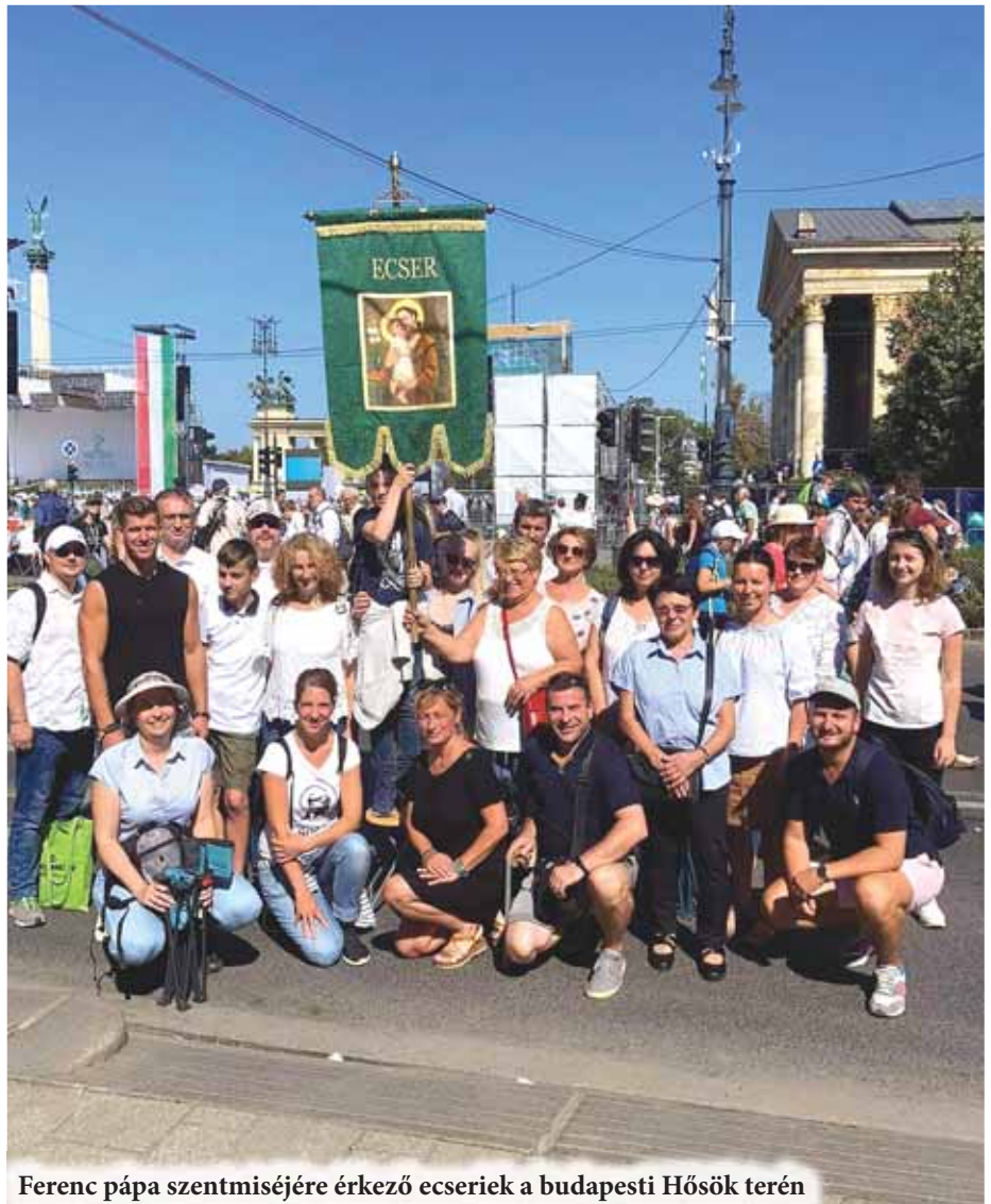
Ferenc pápa szentmiséjére érkező ecseriek a budapesti Hősök terén