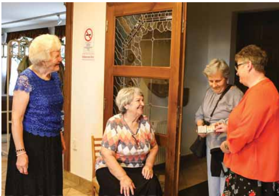
Szigorú egészségügyi ellenőrzés a bejáratnál