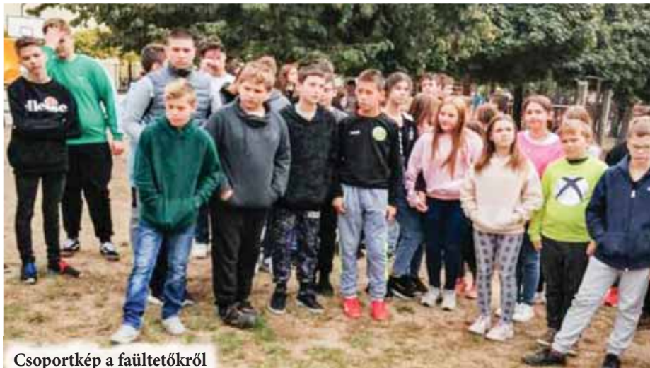
Csoportkép a faültetőről

úgy gondolom, hogy az ilyen akcióknak nagy a nevelési értéke több oldalról is. Egyrészt a környezetvédelem, másrészt a fizikai munka megbecsülése terén.