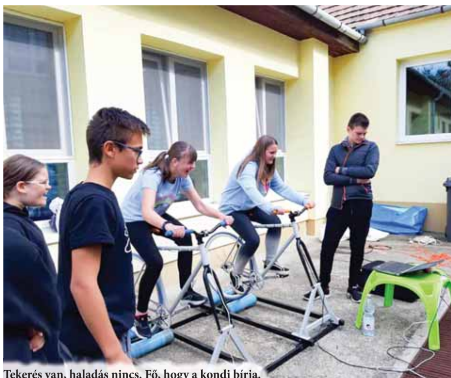
Tekerés van, haladás nincs. Fő, hogy a kondi bírja.

Szeptember 27-én és 28-án papírt gyűjtöttek a lakysok. Ismét nagy volt a lelkesedés a gyerekek és a szülők részéről is. Majdnem 6 tonna (5900 kg) papír gyűlt össze megint, pedig nemrég volt papírgyűjtés. Látva a szorgos talicskázást, a 8. osztályosok munkáját a konténerek körül