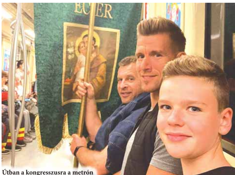
Útban a kongresszusra a metrón