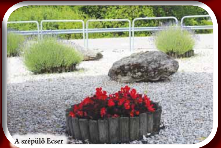
A szépülő Ecsér