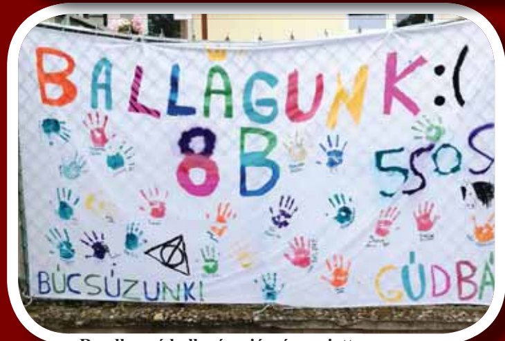
Rendhagyó ballagás a járvány miatt