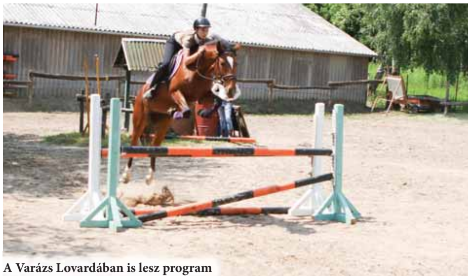
A Varázs Lovardában is lesz program

tábor bázisának helyszíne változhat, annak függvényében, hogy az iparterület fejlesztését érintő beruházások elkezdődnek-e addig. Ha a munkálatok megkezdődnek, a tábor az építkezési terület mellett nem lesz