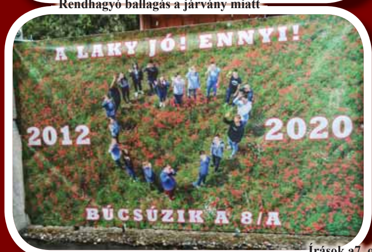
Írások a 7. oldalon