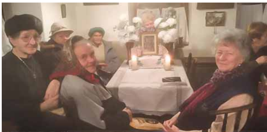
A kisdéd érkezése tiszteletére imádkoztak, énekeltek az eccseri asszonyok a Tájházban

módosult, hogy szintén kilenc nappal szenteste előtt két csoport szerveződik a településen: az idősebbek a Tájházban gyűlnek össze, míg a másik csoport este 7 órakor indul, hogy minden este más-más ünnepváró családhoz kopogtasson be. Így történt ez idén is, és december 15-én az idősebbek csoportjában mintegy 23-25 fő érkezett a tájházba. Itt a tisztaszoba asztalán a szentképből és virágokból kis oltárt készítettek, mely köré ülve tartották meg a 9 napig tartó so-