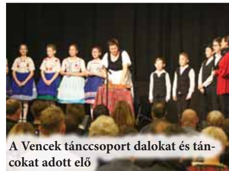
A Vencek tánc-csoport dalokat és táncokat adott elő

Amint színpadra lépett, s felhangzottak előadásában az első hangok, mindenki úgy érezhette egy pár másodpercig, hogy az érzelmi játszanak vele, s a színpadon Máté Péter énekel neki. Sajnos, a szervezők ezt a csodát nem tudták ugyan valóra váltani – ám a még ma is nagy népszerűségnek örvendő énekes da-