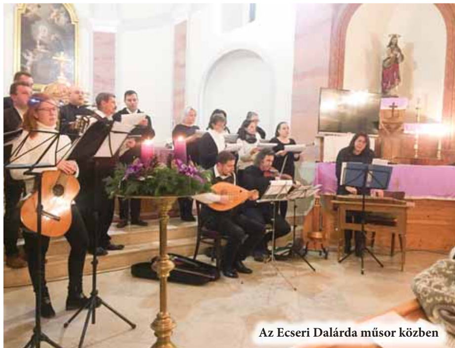
Az Ecseri Dalárda műsor közben

Elsőként „A szeleknek élénk szárnyán” kezdtük kolindát (karácsonyi ének) adták elő, majd a több neves együttes által is már műsorra tűzött 'Kis karácsonyi ének' című megzenésített Adyvers következett. Ezt követően egy olyan ecseri adventi koszorú hangzott el, melynek dallamait száz évvel ezelőtt is énekeltek már az évek ebből az időszakában – s öröndetes, hogy némely hozzájuk fűződő népi hagyomány, mint pl. a szálláskeresés ma is él még. De felhangzott a lányok éneke ahhoz a különleges helyi szokáshoz