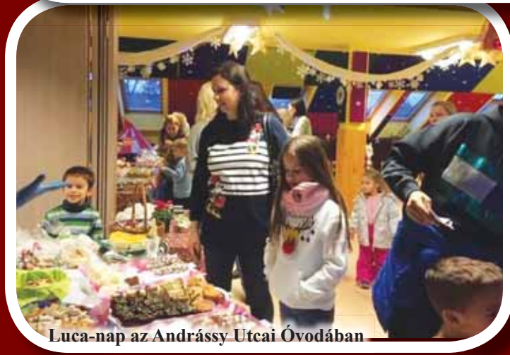
Luca-nap az Andrássy Utcai Óvodában