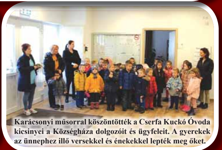
Karácsonyi műsorral köszöntötték a Cserfa Kuckó Óvoda kicsinyei a Községháza dolgozóit és ügyfeleit. A gyerekek az ünnephez illő versekkel és énekekkel lepték meg őket.