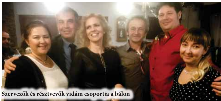
Szervezők és résztvevők vidám csoportja a bálon

italt egyáltalán nem, ám pogácsát, sajtosrudat és egyéb aprósüteményt, úgynevezett 'rágcsát' bőségesen hoztak magukkal, amit az egyesület tagjai mind maguk sütöttek otthon, a bálra készülődve. A tánc mellett az újévvárók részt vehettek a folyamatos tombolahúzáson is, amin nagyobb értékű műszaki cikkeket sorsoltak ki. A szervező hölgyek elmondták, hogy ebben idén az az elv vezérelte őket, hogy inkább kevesebb, de olyan értékesebb tárgy találjon gazdára,