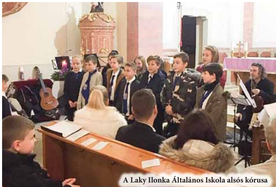
A Laky Ilonka Általános Iskola alsós kórusa

Próbáikat a művelődési házban tartják rendszeresen, melyek egy-egy fellépés előtt megszapo-