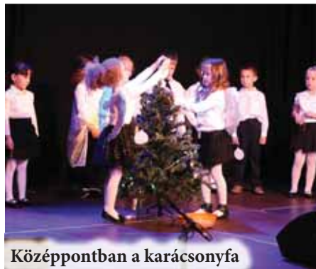
Középpontban a karácsonyfa