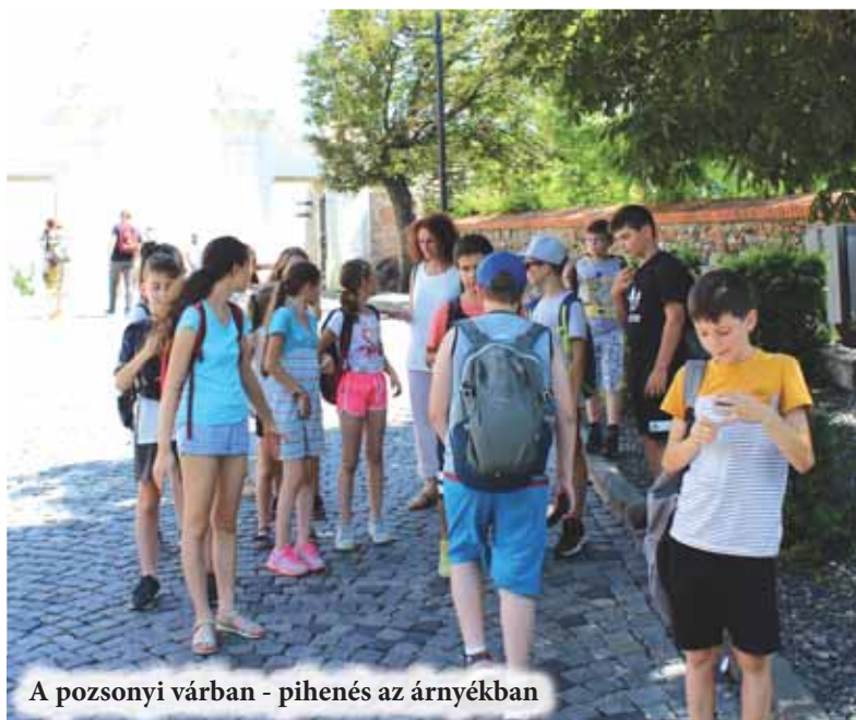
A pozsonyi várban - pihenés az árnyékban