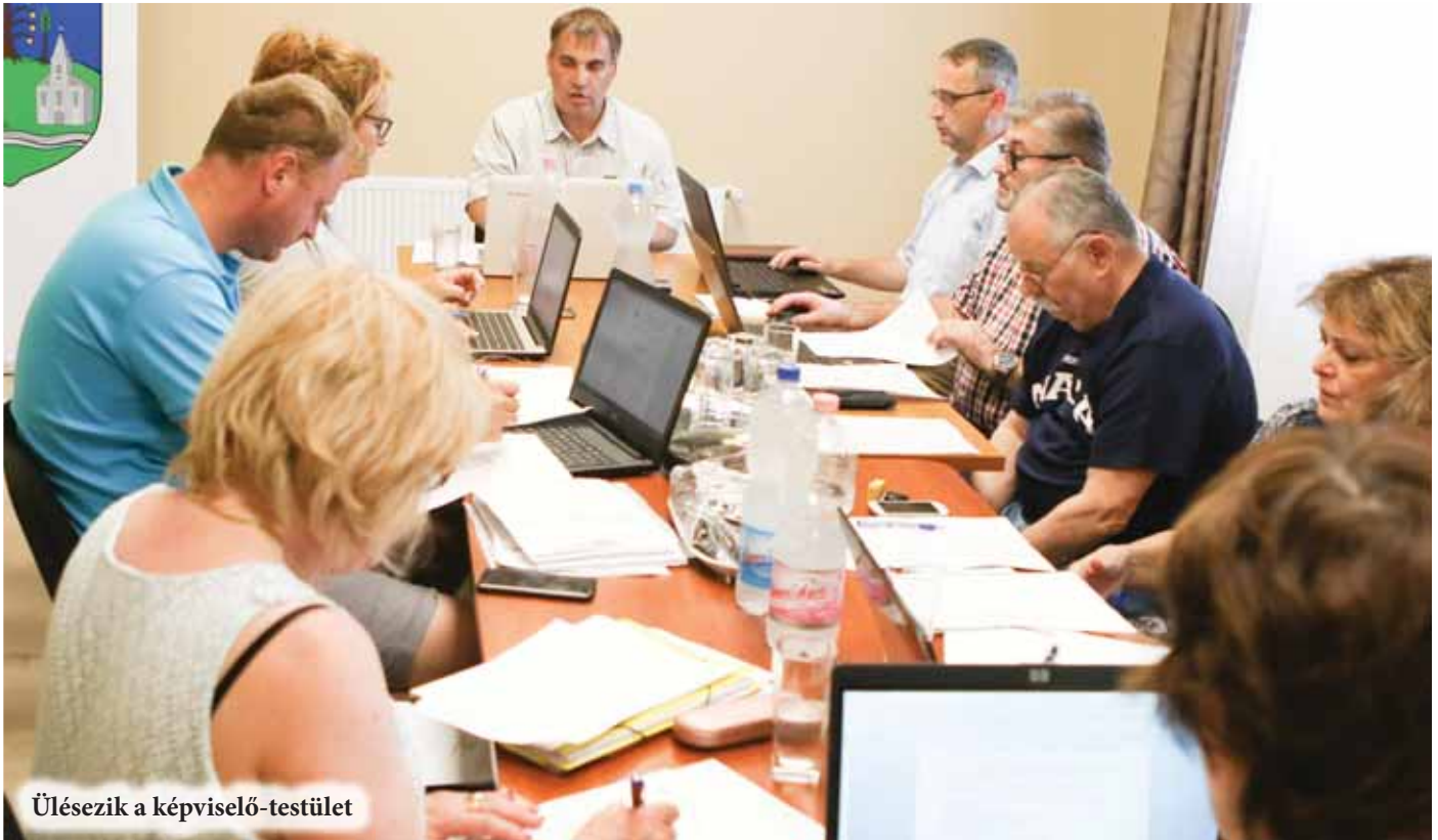
Ülésezik a képviselő-testület