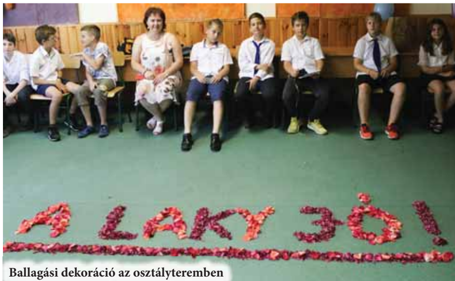
Ballagási dekoráció az osztályteremben

iskola viszont megőrzi az emléküket. Végül azt találta a leghelyesebbnek, ha ez a beszéd most róluk, a ballagókról s az iskolával való kapcsolatukról szól. Hangsúlyozta, hogy jól ismeri valamennyiüket, hiszen hetente négy magyar- és két történelemórát töltöttek együtt. Ennyiszor hangzott el az „Osztály vigyázz!” vezényszó, valamint a figyelmeztetés, hogy „Jön a Kiss K.!” Mindehhez adódtak még a táborok, a közös iskolai rendezvények, amik további lehetőséget jelentettek ahhoz, hogy kölcsönösen jól megismerjék egymást. Olyannyira, hogy ha a lányok furcsa tekintettel néztek rá a padokból, már tudta, hogy készülöben van