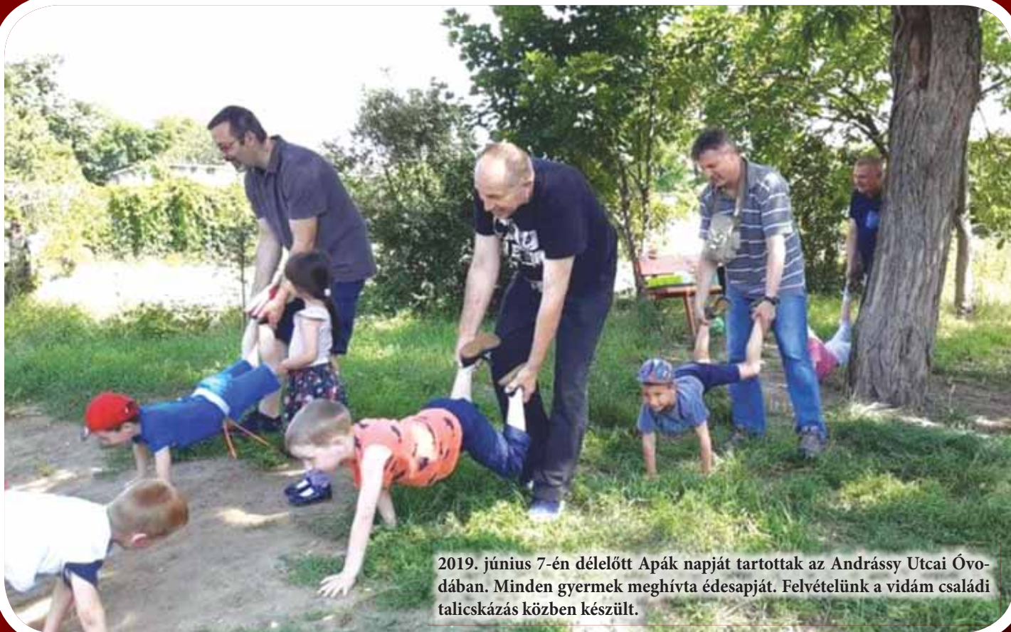
2019. június 7-én délelőtt Apák napját tartottak az Andrassy Utcai Óvodában. Minden gyermek meghívta édesapját. Felvételünk a vidám családi talicskázás közben készült.