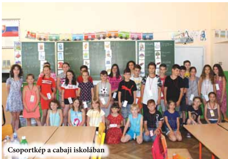
Csoportkép a cabaji iskolában