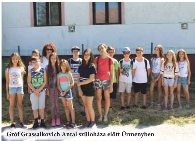
Gróf Grassalkovich Antal szülőháza előtt Ürményben