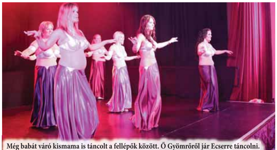
Még babát váró kismama is táncolt a fellépők között. Ő Gyömrőről jár Ecserre táncolni.

Gyömrőn lakik, s ahová fodrásznőjén keresztül jutott el a hír az ecseri hastáncórakról. Így már két éve jár el a próbákra és vesz részt a fellépéseken is. Ami pedig ideai szereplésének különlegességét adta nem más, mint hogy 7 hónapos terhesen második kislányát várja. Ám erre az időre sem szeretne volna abbahagyni a táncot és elszokni tőle, hiszen a kicsi megérkezése után úgyis lesz majd egy kényes kis pihenő. Nagyobbik gyermeke 7 éves, s a kislány annyira megkedvelte a hastáncot, hogy – jóllehet munka mellett nem volt lehetőség arra, hogy rendszeresen elhordják a próbákra – hozzácsapódott az ovisokhoz, miközben az anyukáját kísérte el az órákra.