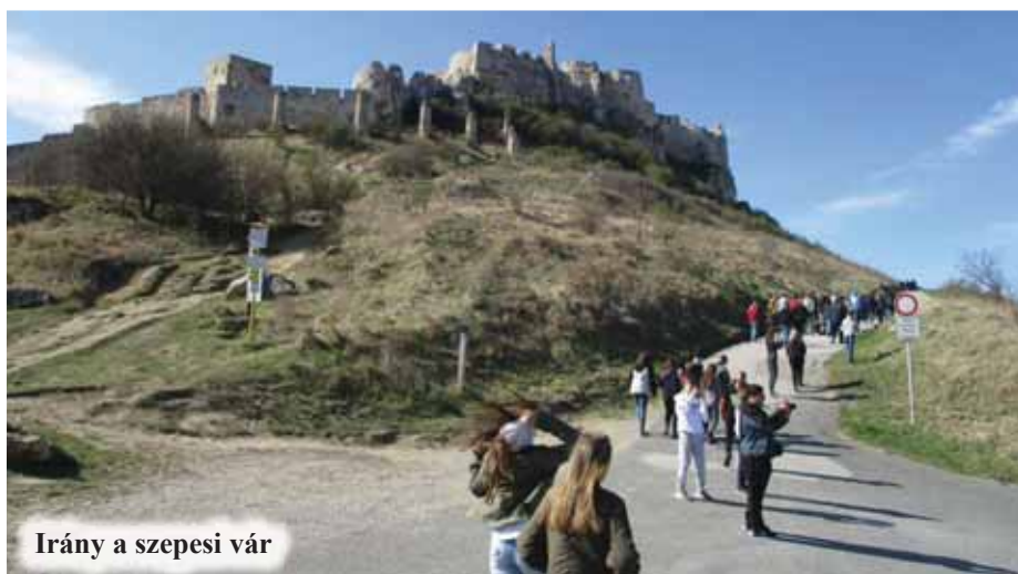
Irány a szeptesi vár

redés után összecsomagoltunk, megreggeliztünk, elbúcsúztunk a házigazdától és buszunkkal Szlovákia második legnagyobb városába, Kassára indultunk. Az idő sajnos már nem volt olyan napfényes, de ez nem szegte kedvünket és először a Szent Erzsébet főszékesegyházba mentünk. A templombelső megtekintése után az altemplomba, ismertebb nevén a Rákóczi-kriptába