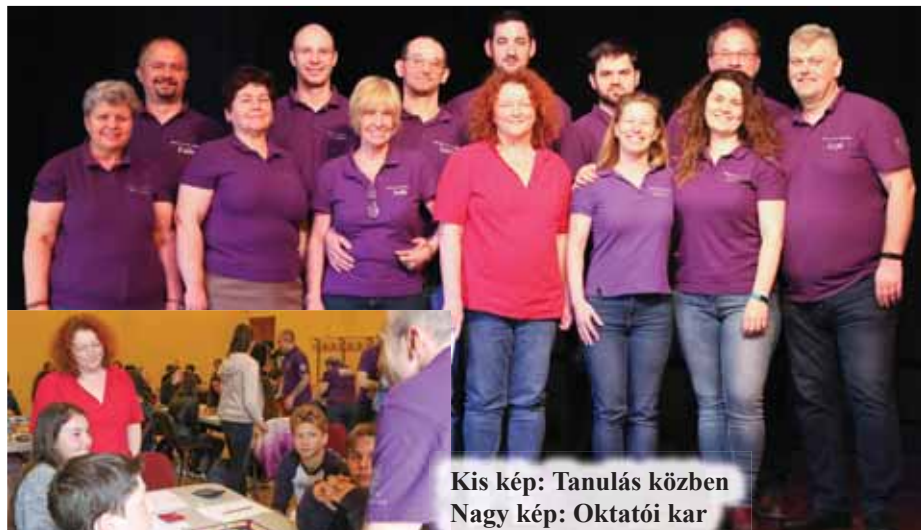
Kis kép: Tanulás közben Nagy kép: Oktatói kar

ellátására. A Monopolyhoz képest plusz eszközök, egy tábla és kártyák is vannak a játékhoz, valamint a tanítandó ismeretek között szerepel az eredménykimutatás is a rendszeres bevételekkel és kiadásokkal együtt. Szerepel benne továbbá a pénzügyi mérleg is a rendelkezésre álló eszközökkel és kötelezettségekkel/forrásokkal. A játék során pedig az az elrendő cél, hogy a belső körből, a mókuserékből ki tudjanak törni a külső, gyorsító sávba. Ehhez pedig eszközök felhalmozására van szükség. S amikor a passzív