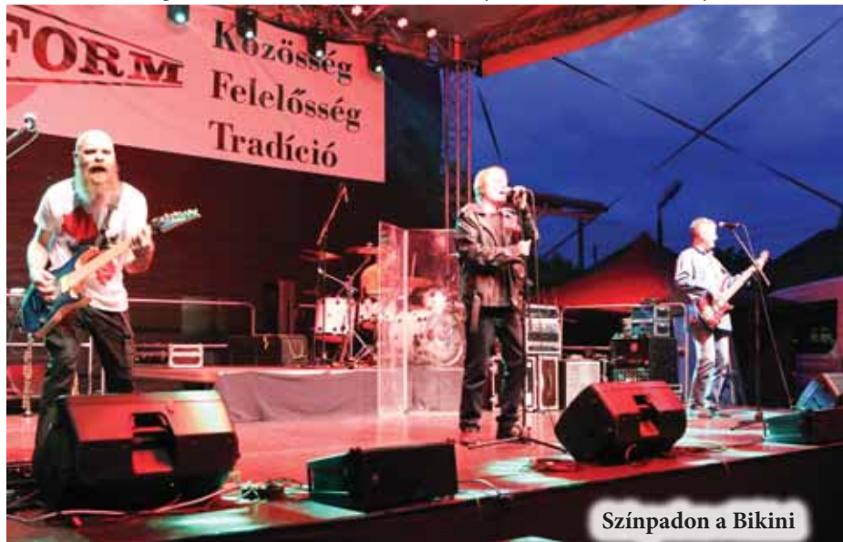
Színpadon a Bikini

cég belföldi és nemzetközi stábjába, valamint Koszta D50 és Koszta D77 néven a GLS feladatokat ellátó munkatársak, továbbá a cég által támogatott s mára már hagyományossá vált teniszversenyek résztvevői-