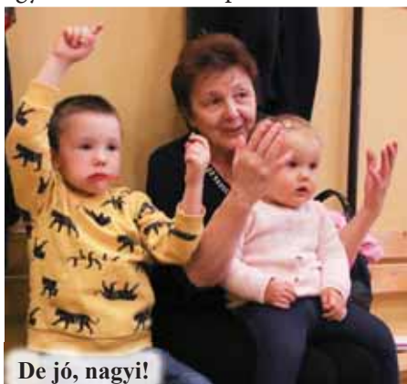
De jó, nagyi!