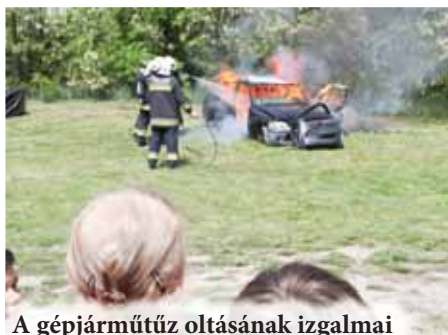
A gépjárműtűz oltásának izgalmi

Napközben egy kisvonat is járta a falu utcáit, amire mindenki felszállhatott, hogy gépkocsihaszna- lat s az ezzel járó parkolóhelyigény nélkül ingyenesen kijuthasson a sportpályára. Este 18 óra után pedig többször átment a két közeli településre, Ve-