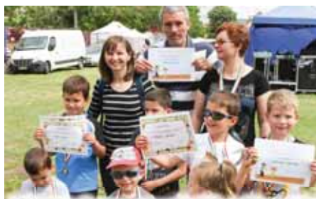
A kerékpáros verseny boldog díjazottjai