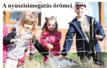
A nyuszisimogatás örömei