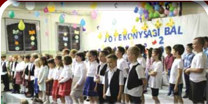
Május 4-én tartotta a Laky Ilonka Általános Iskola jótékonyági estjét. A hetek óta szorgalmasan készülő diákok osztályonként egy-egy produkcióval léptek a tornaterem színpadára, hogy bemutassák műsorukat szüleiknek, nagyszüleiknek.