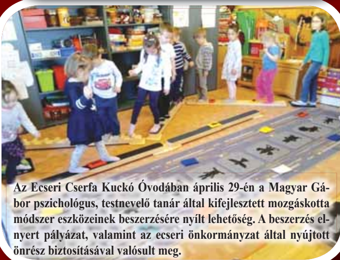
Az Ecseri Cserfa Kuckó Óvodában április 29-én a Magyar Gábor pszichológus, testnevelő tanár által kifejlesztett mozgáskotta módszer eszközeinek beszerzésére nyílt lehetőség. A beszerzés elnyert pályázat, valamint az ecseri önkormányzat által nyújtott önrész biztosításával valósult meg.