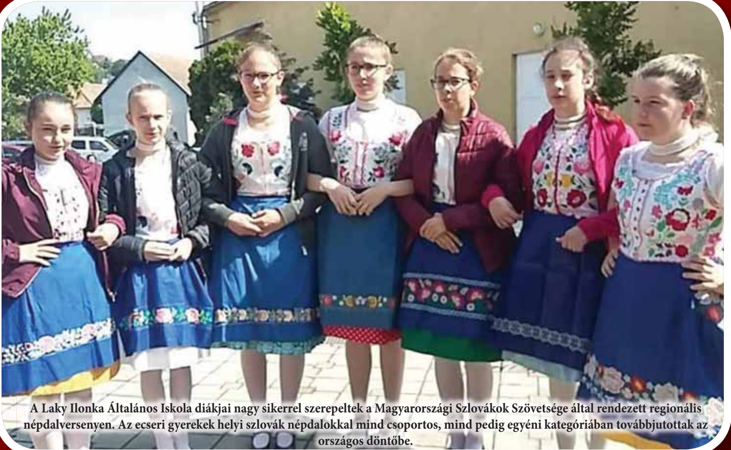
A Laky Ilonka Általános Iskola diákjai nagy sikerrel szerepeltek a Magyarországi Szlovákok Szövetsége által rendezett regionális népdalversenyen. Az ecseri gyerekek helyi szlovák népdalokkal mind csoportos, mind pedig egyéni kategóriában továbbjutottak az országos döntőbe.