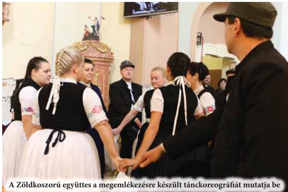
A Zöldkoszorú együttes a megemlékezésre készült tánckoreográfiát mutatja be