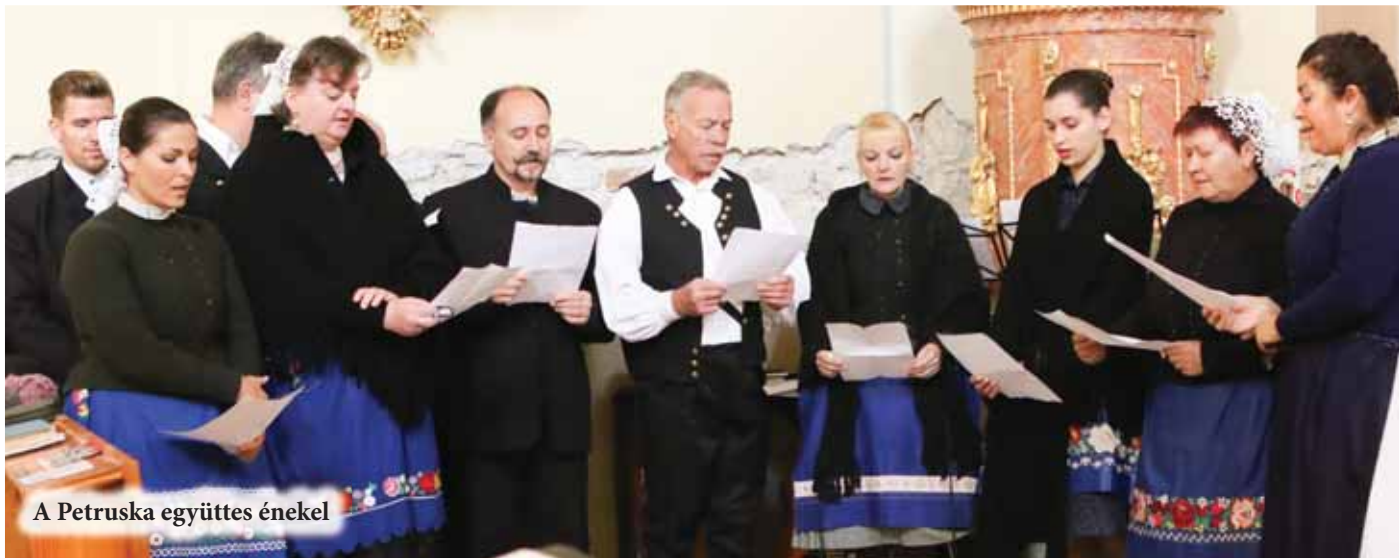
A Petruska együttes énekel