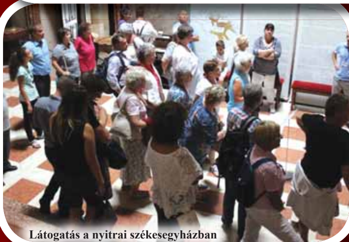
Látogatás a nyitrai székesegyházban