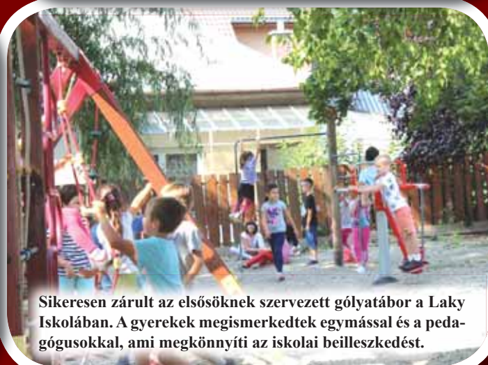
Sikeresen zárult az elsősöknek szervezett gólyatábor a Laky Iskolában. A gyerekek megismerkedtek egymással és a pedagógusokkal, ami megkönnyíti az iskolai beilleszkedést.