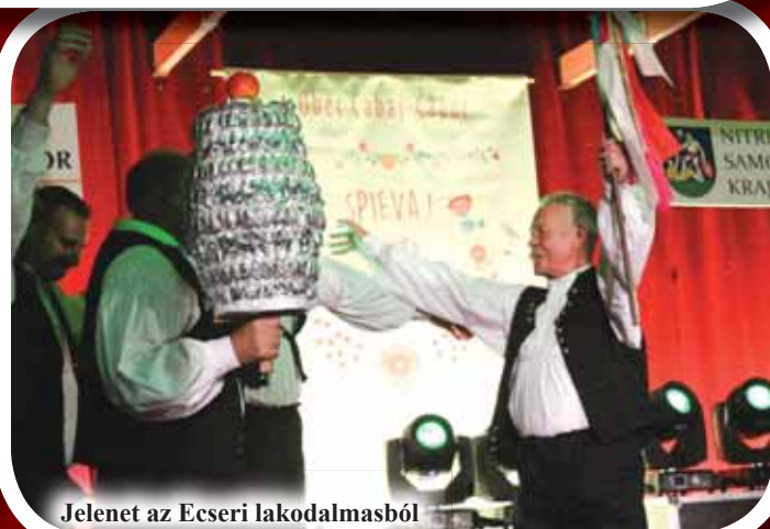
Jelenet az Ecseri lakodalmásból