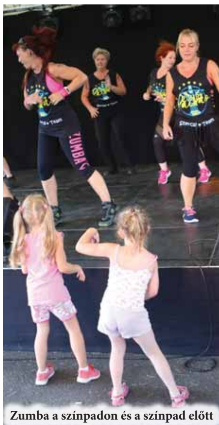
Zumba a színpadon és a színpad előtt