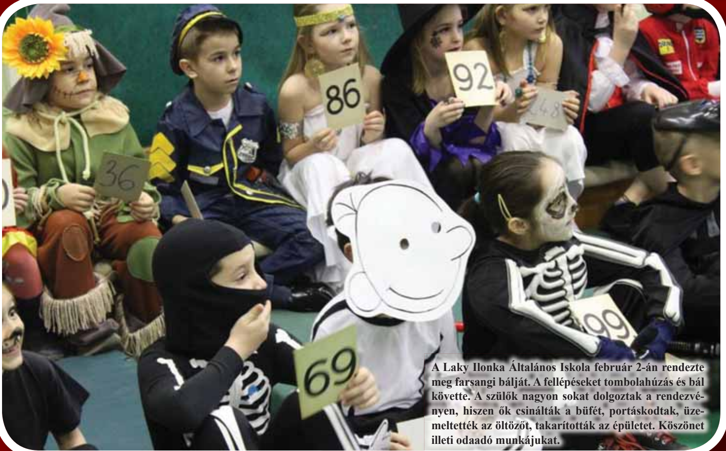
A Laky Ilonka Általános Iskola február 2-án rendezte meg farsangi bálját. A fellépéseket tombolahúzás és bál követte. A szülők nagyon sokat dolgoztak a rendezvényen, hiszen ők csinálták a büfét, portáskodtak, üzemeltették az öltözőt, takarították az épületet. Köszönet illeti odaadó munkájukat.