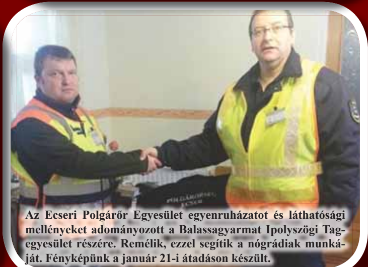
Az Ecséri Polgárőr Egyesület egyenruházatot és láthatósági mellényeket adományozott a Balassagyarmat Ipolyszögi Tag-egyesület részére. Remélik, ezzel segítik a nógrádiak munkáját. Fényképünk a január 21-i átadáson készült.