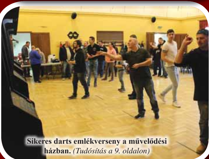
Sikeres darts emlékverseny a művelődési házban. (Tudósítás a 9. oldalon)