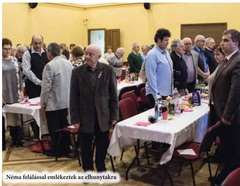
Néma felállással emlékeztek az elhunytakra

Bútorlapszabászat: bútorlapanyagok és bútorvasalatok széles választéka. Egyedi bútorkészítés: konyhabútor, nappali bútor, fürdőszobabútor, tolaajtós gardrób-rendszerek és egyéb lapbútorok készítését vállaljuk.