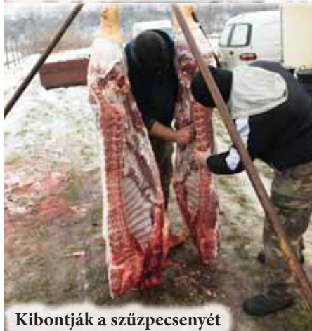
Kibontják a szűzpecsenyét