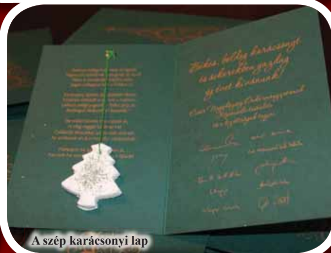
A szép karácsonyi lap