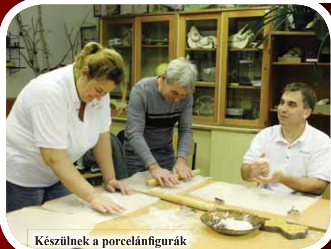
Készülnek a porcelánfigurák