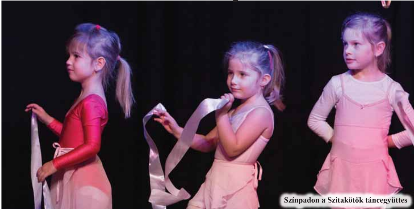
Színpadon a Szitakötők táncegyüttes

December 19-én rendezte meg a Rábai Miklós Művelődési és Közösségi Ház a karácsonyi ünnepeket megelőző, mindig nagy érdeklődésre számot tartó műsorát. Az est folyamán felléptek az ecseri táncsoportok. A meghívott előadóművész Takács Nicolas volt.