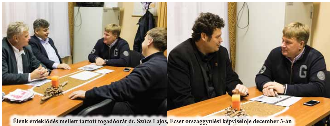
Élénk érdeklődés mellett tartott fogadóórát dr. Szücs Lajos, Ecsér országgyűlési képviselője december 3-án

kell, mi lesz a döntés ára, következménye. A Nemzetgazdasági Minisztérium, a Központi Statisztikai Hivatal, a Nemzeti Fejlesztési Minisztérium, a Közigazgatási és Igazságügyi Minisztérium közösen fogja előkészíteni a döntést, minden szükséges információt rendelkezésre fognak bocsátani, de az önkormányzatoknak kell ebben a kérdésben állást foglalniuk. Nem szeretném, ha 2020 után, amikor szétválasztottuk a Fővárost és Pest megyét, s mégsem az lett belőle, amit szerettek volna az érintettek. Minden településnek magának kell döntenie.