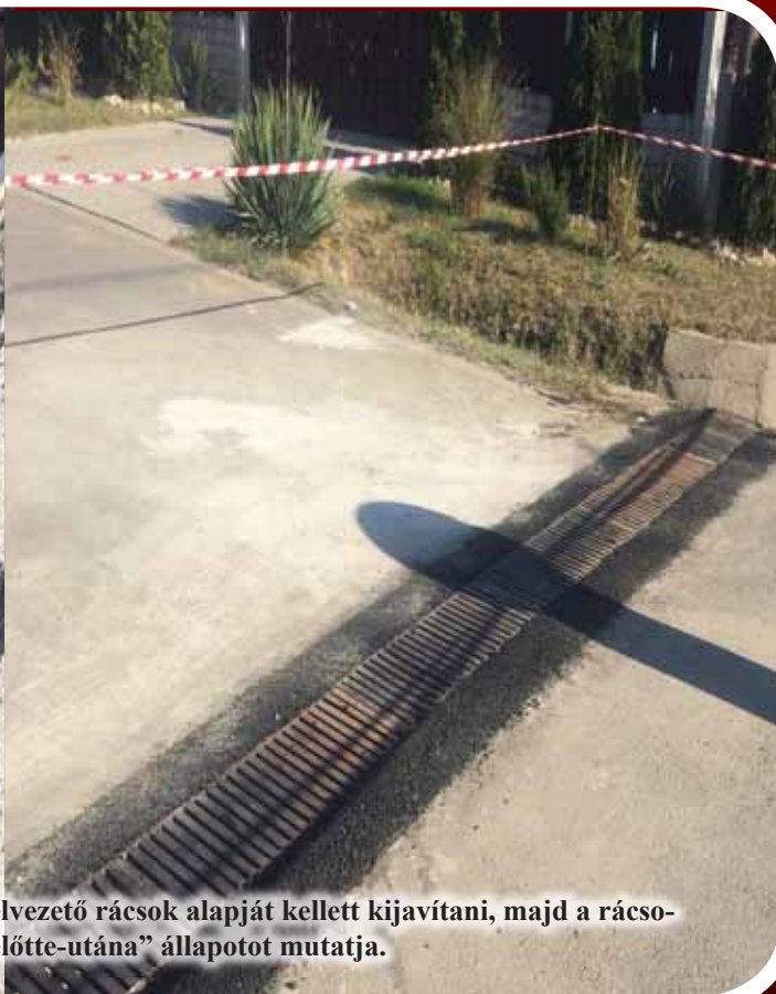
A Kálvária lakónegyedben a tönkrement csapadékvízvezető rácsok alapját kellett kijavítani, majd a rácsokat kicserélni. Felvételünk az „előtte-utána” állapotot mutatja.