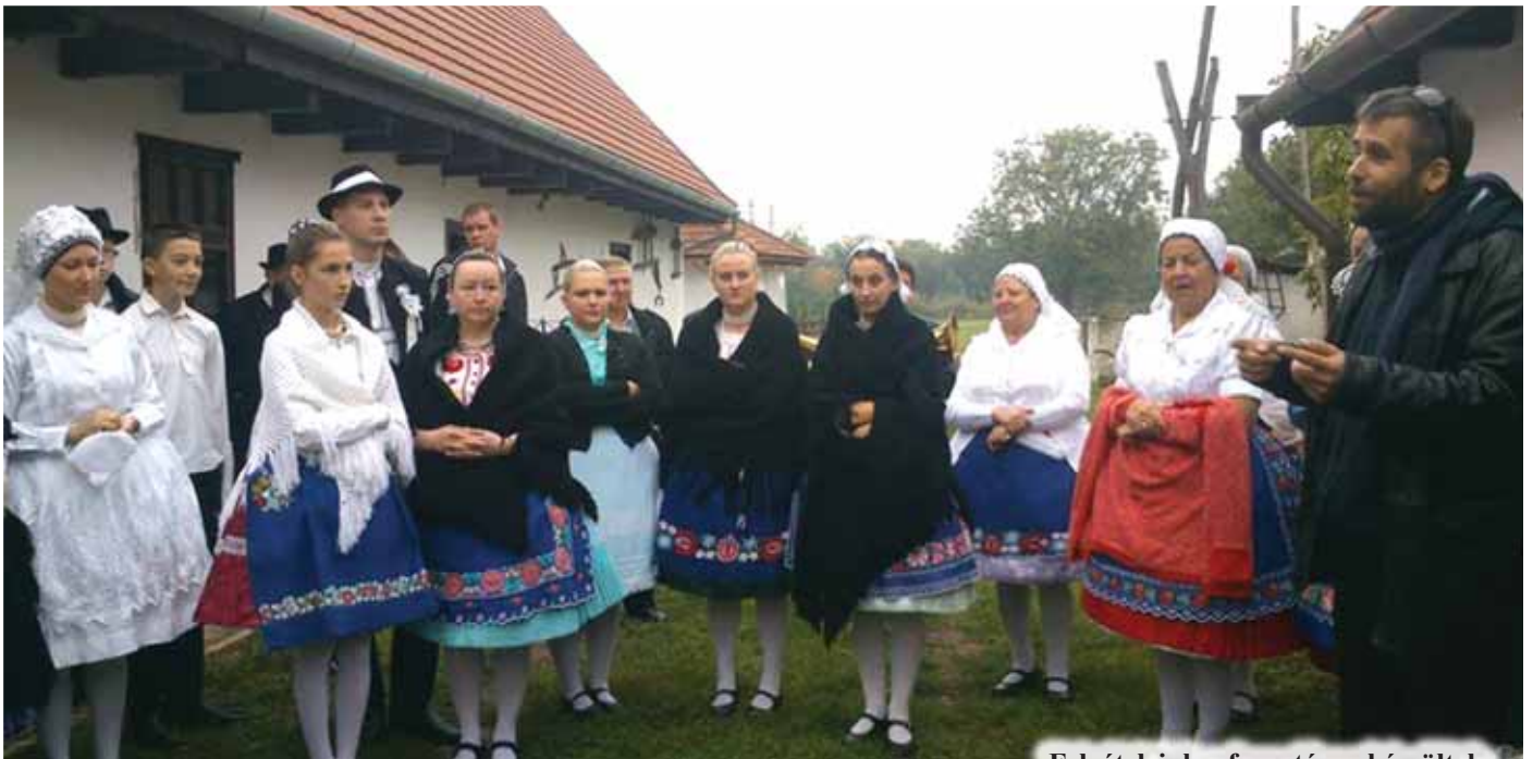
Felvételeink a forgatáson készültek

December 13-án 15 órai kezdettel lesz a premier, ekkor mutatják be az Ecseri lakodalmas című film új változatát a Rábai Miklós Művelődési Házban.