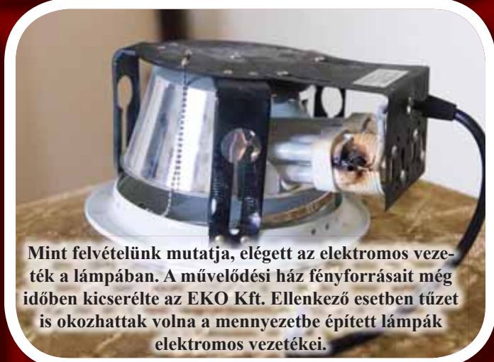
Mint felvételünk mutatja, elégett az elektromos vezeték a lámpában. A művelődési ház fényforrásait még időben kicserélte az EKO Kft. Ellenkező esetben tüzet is okozhattak volna a mennyezetbe épített lámpák elektromos vezetékai.