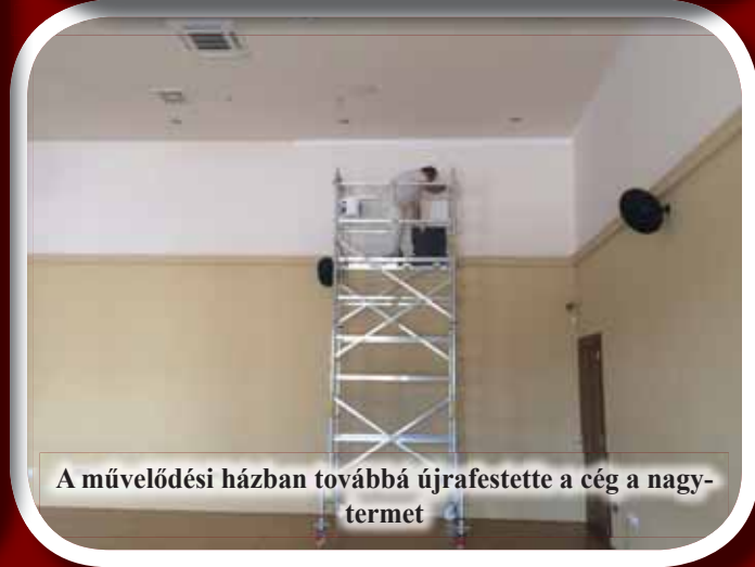
A művelődési házban továbbá újrafestette a cég a nagytermet