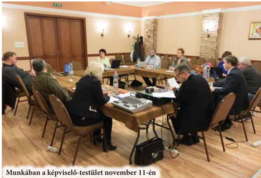
Munkában a képviselő-testület november 11-én

A képviselők rendeletet alkottak a forgalomcsillapító küszöb (fekvőrendőr) létesítésének feltételeiről. Ilyen eszköz kivitelezésére csak akkor kerülhet sor, ha annak teljes költségét a kezdeményezők magukra vállalják és az összeget a munkálatok megkezdése előtt teljes egészében megfizetik az önkormányzatnak. Szükséges továbbá, hogy az érintett közterület ingatlanulajdonosainak több, mint 60%-a támogassa a kezdeményezést, il-