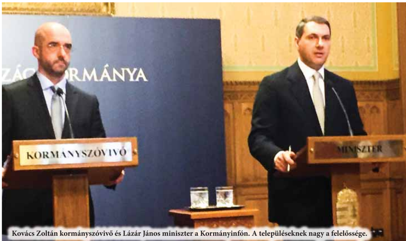
Kovács Zoltán kormánybiztos és Lázár János miniszter a Kormányinfón. A településeknek nagy a felelőssége.