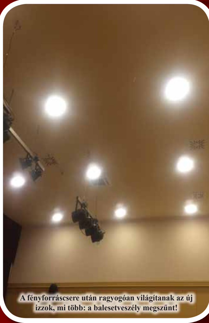
A fényforráscsere után ragyogóan világítanak az új izzok, mi több: a balesetveszély megszűnt!