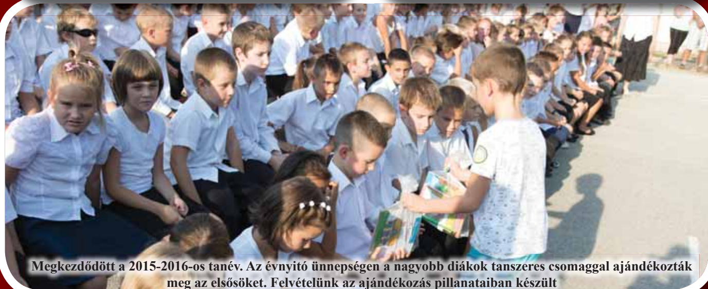
Megkezdődött a 2015-2016-os tanév. Az évnyitó ünnepségen a nagyobb diákok tanszeres csomaggal ajándékozták meg az elsősöket. Felvételünk az ajándékozás pillanataiban készült