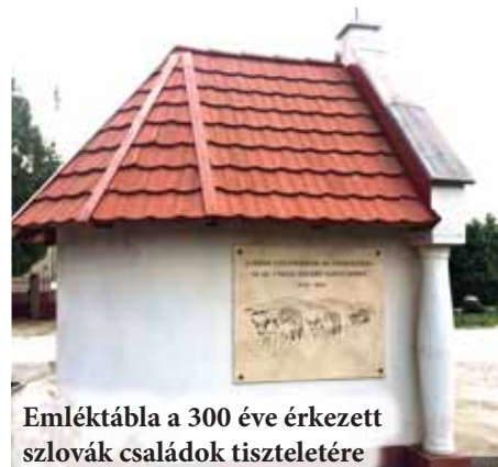
Emléktábla a 300 éve érkezett szlovák családok tiszteletére

címerét is. Ha a fa mögé nézünk, egy nagy ecséri történelemkönyv nyílik ki előttünk, mely családneveken keresztül mutatja be a falu történetét. Itt találjuk a 700 évvel ezelőtti földbirtokos nevét, a 300 éve érkezett első telepesek neveit, az Ecsert újraterelítő Grassalkovichok nevét, a Rákóczi szabadságharcban részt vett ecséri katonák neveit is. Szerepelnek az emlékművön a háborúk ecséri hőseinek családnevei, a tanácsköztársaság helyi vezetői, a Szlovákiából áttelepült családok sora és az 56-os ecséri nemzeti bizottság elnökének neve is. Ha mélyen a sorok közé néztünk, megtaláljuk templomunk építése óta az összes itt szolgáló papot, az ecséri bírót, tanácselnököket, tanácsbírákat, polgármestereket, jegyzőket, tanítókat, kántorokat, harangozókat, a bábasszonyt, a tűzoltó parancsnokot, az óvónóket, iskolaigazgatókat, de meggyilkolt papunk és jegyzőnk neve, valamint falunk botanikus tudós szülöttének neve is szerepel a táblákon. És természetesen sok-sok ecséri családnév, akik alakították és ma is alakítják és gyarapítják településünket. Az emlékmű minden ecséri polgár összetartozásának kifejezése, így mindenki neve felkerülhetett rá, aki